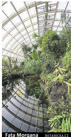
Fata Morgana