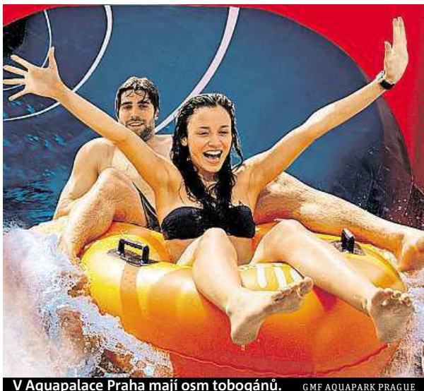
V Aquapalace Praha mají osm tobogánů.