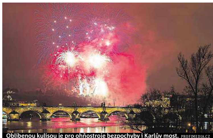
Oblíbenou kulisou je pro ohňostroje bezpochyby i Karlův most.