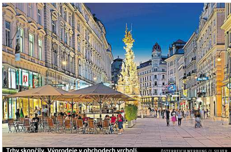
Trhy skončily. Výprodeje v obchodech vrcholí.