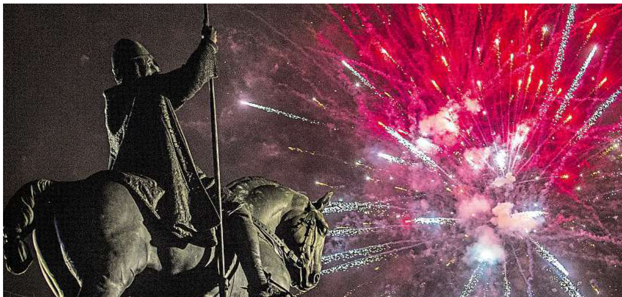
Tři, dva, jedna... Nový rok! Oslavy se blíží. Podívejte se, jaký program chystají kluby v Praze a dalších městech. Více str. 6 MAFRA

Deset zoologických zahrad. Čtete velký přehled otevírací doby, vstupného a speciálních akcí ke konci roku. Přijďte! Šéf trojské zoo Miroslav Bobek říká, že si zvířata užijete. 2016. Novinky příštího roku STRANY 2 a 3