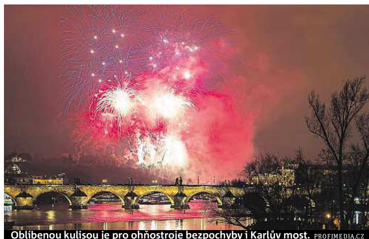
Oblíbenou kulisou je pro ohňostroje bezpochyby i Karlův most.