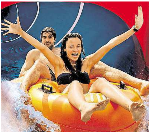
V Aquapalace Praha mají osm tobogánů.