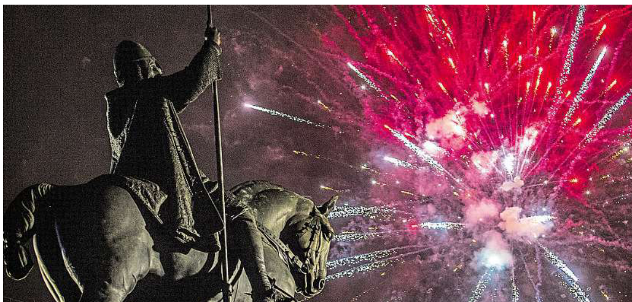
Tři, dva, jedna... Nový rok! Oslavy se blíží. Podívejte se, jaký program chystají kluby v Praze a dalších městech. Více str. 6 MAFRA

Deset zoologických zahrad. Čtete velký přehled otevírací doby, vstupného a speciálních akcí ke konci roku. Přijďte! Šéf trojské zoo Miroslav Bobek říká, že si zvířata užijete. 2016. Novinky příštího roku STRANY 2 a 3