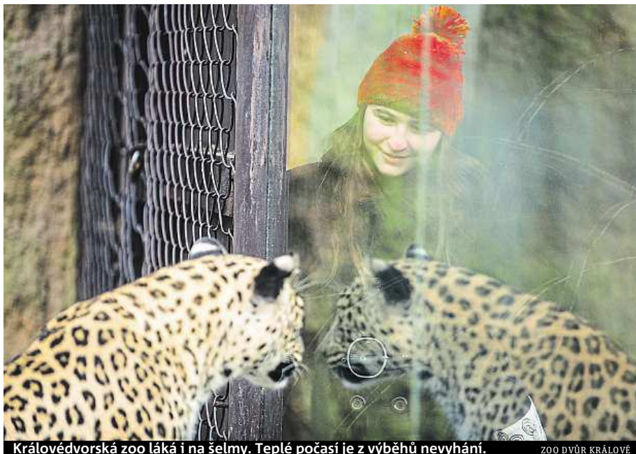
Královédvorská zoo láká i na šelmy. Teplé počasí je z výběhů nevyhání. ZOO DVŮR KRÁLOVÉ

„Máme v nabídkě sváteční komentované prohlídky, které budou probíhat 28., 29., 30. a 31. 12. vždy od 10 hodin. Na trase bude zájemce provázet pracovník zahrady, který jim během devadesátiminutové prohlídky prozradí mnoho zajímavých informací o zvířatech i ze zákulisí zoo. Za tuto službu si návštěvníci připlatí 30 korun k běžnému vstupnému,“ říká mluvčí liberecké zoo Jan Kubánek.