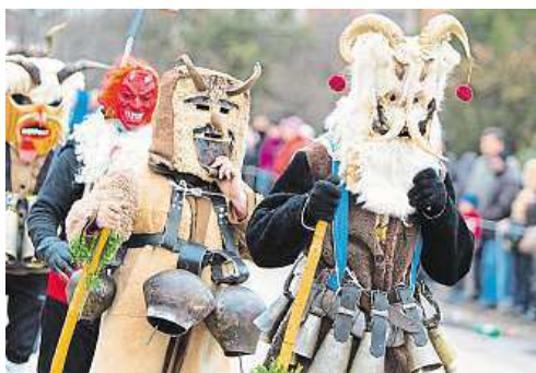
Bulhaři při rituálu kukri vyhánějí zlé duchy.

Poláci na Nový rok doma na úklid nesáhnou. Bojí se, aby jim se smetím z domu neodešlo štěstí. V Recku lidé za-