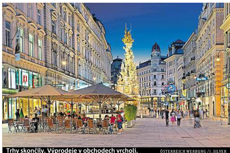
Trhy skončily. Výprodeje v obchodech vrcholí.