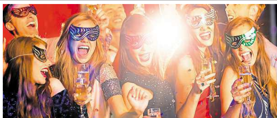
A co se chystá v Praze?

Asi největší mejdan ve městě uspořádají v klubu Pantheon. Poslední akce roku s názvem Excelentní Silvestr 2015 nabídne zajímavé akce. Happy Hour, kdy dostanete dva drinky za cenu jednoho, proběhne od 21 do 22 hodin, rozdají tu stovky minisektů, těšit se můžete na velkou tombolu, laserovou show a muziku.