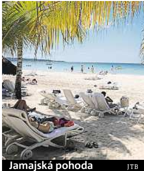
Jamajská pohoda JTB

Češi se nebojí a létají za teplem. S cestovkou i po vlastní ose.