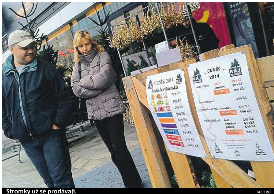
Stromky už se prodávají.