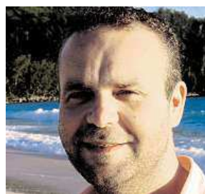
Radovan Krejčíř

Radovan Krejčíř si podplácením politiků chtěl zajistit úspěch při azylovém řízení.