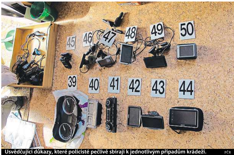
Usvědčující důkazy, které policisté pečlivě sbírají k jednotlivým případům krádeží. PCR

Dobrá sluha, zlý pán – tvrdí-li naši dědové o ohni. Podob-