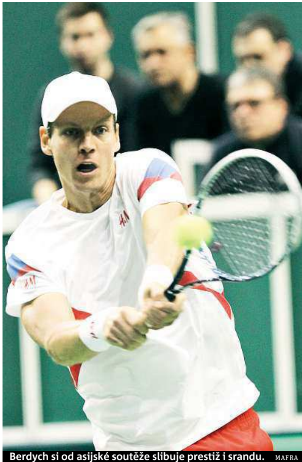
Berdych si od asijské soutěže slibuje prestiž i sranda. MAFRA

Prezident mužské soutěže ATP Chris Kermode nepokládá nový asijský podnik za konkurenci pro zavedené turnaje. „Nemám s tím problém. Nemá to nic společného s obchodními zájmy ATP,“ uvedl. „Je jen a jen věcí samotných hráčů, co dělají mimo sezónu. I když předtím kritizují nabitý program turnajů, ale potom létají přes půl zeměkoule na exhibice,“ řekl Kermode. ČTK