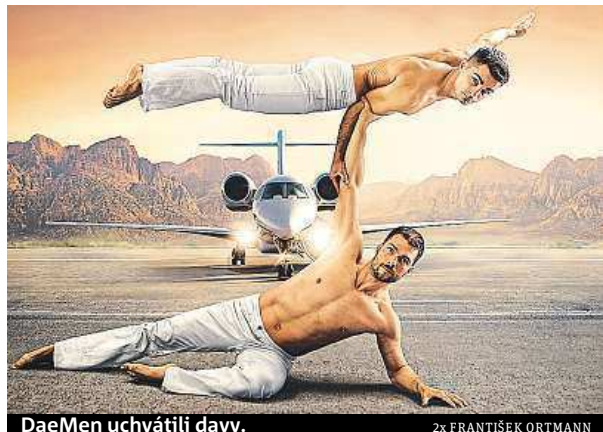
DaeMen uchvátili davu.