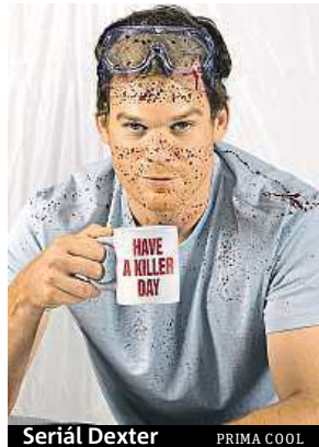
Seriál Dexter PRIMA COOL

Češi si libují v mordech, detektivkách a vůbec zprávách z rubriky černá kronika. Takových diváků je prý v tuzemsku drtivá většina. Vyplynulo to z průzkumu společnosti Axocom.