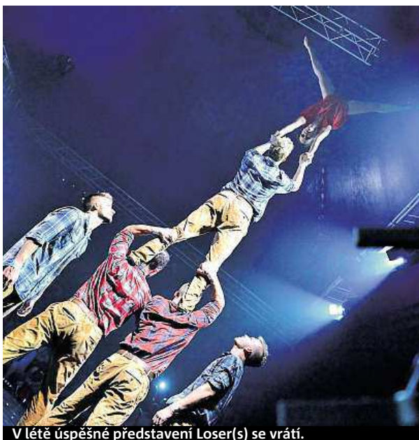
V létě úspěšně představení Loser(s) se vrací.

Akrobacie je velmi riziková. Musíme být na sebe opatrní, nemáme za sebe záskok. Nedávno si jeden performer zranil koleno, musel jít na chirurgický zákrok a byl vyřazen na tři týdny. Taky nám přibývají roky, ale myslím, že na jevišti budeme ještě v padesáti. MAP