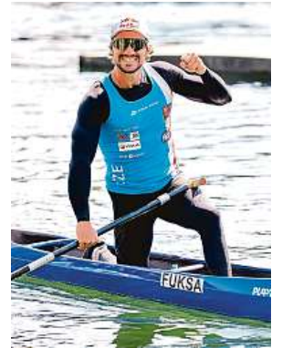
Martin Fuksa se raduje z titulu mistra světa.