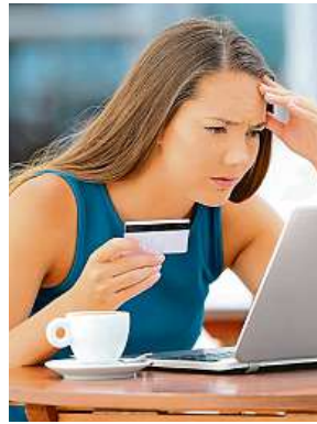
Mnoho zákazníků hledá levnější varianty nákupů.

Navíc Češi zjišťují, že při porovnávání cen včetně zahraničních marketplaců vycházejí domácí e-shopy často jako příliš drahé.