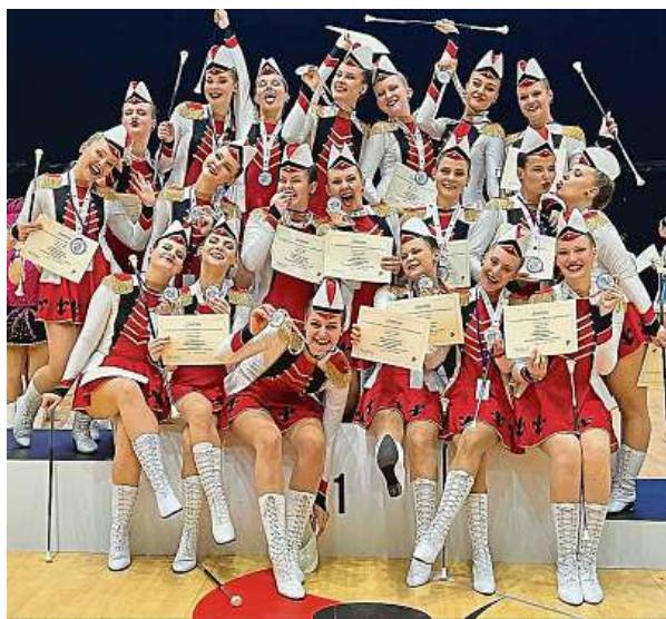
Mažoretky seniorské kategorie na stupních vítězů během MS v Liverpoolu. Domů do Česka si odvezly titul mistryň světa.