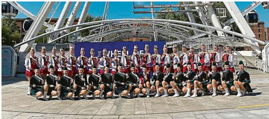
Pražské mažoretky na mistrovství světa v anglickém Liverpoolu. Na fotografii jsou vidět obě skupiny, jak seniorská, tak juniorská.