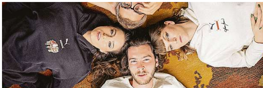
Značka Puma se rozhodla spojit právě s Bicanem, a to rovnou dvakrát za poslední tři roky. Kolekce se společnou DNA a upcyclingem se jmenují My děti ze stanice 2020 a Horská dráha.

v dokonalé hře broadwayského scénáře s tím nejzářivějším hereckým obsazením.