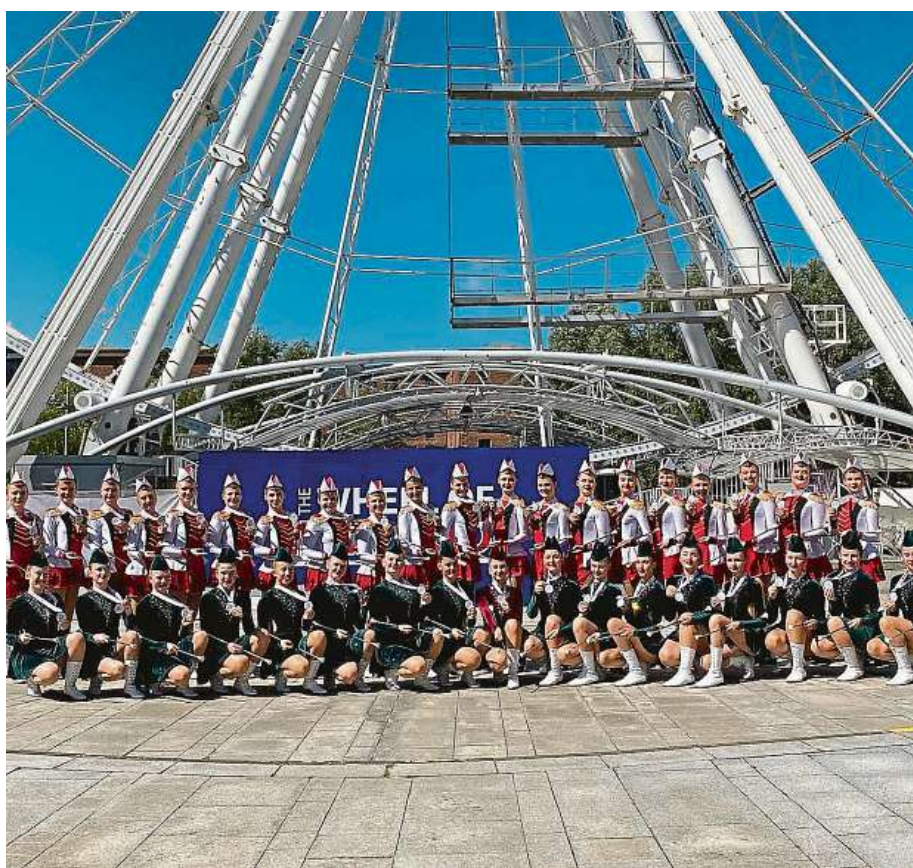
Pražské mažoretky na mistrovství světa v anglickém Liverpoolu. Na fotografii jsou vidět obě skupiny, jak seniorská, tak juniorská.

Pravidla pro soutěž MS jsou přísná. Povoleny jsou například pouze prvky, kde hůlku drží jedna nebo obě ruce. Je to převážně pochodová choreografie, ocení se i taneční prvky.