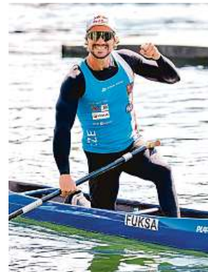
Martin Fuksa se raduje z titulu mistra světa.