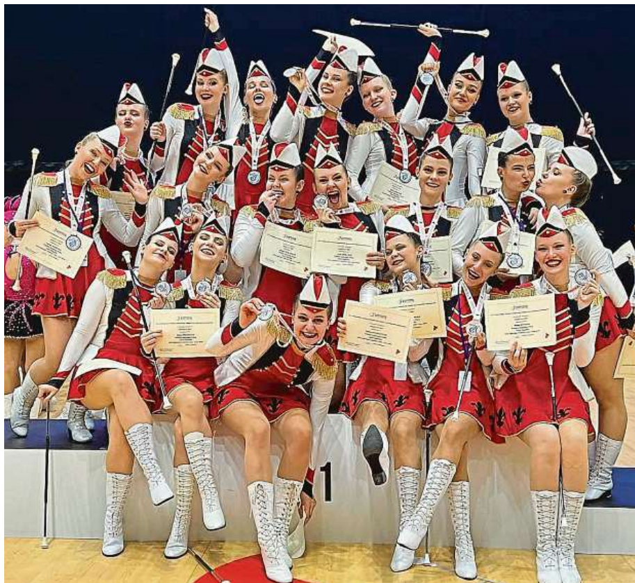
Mažoretky seniorské kategorie na stupních vítězů během mistrovství světa v Liverpoolu. Domů do Česka si odvezly titul mistryň světa.

Podle jejích slov juniorská skupina využila rozmanitost tanečních kroků, seniorská