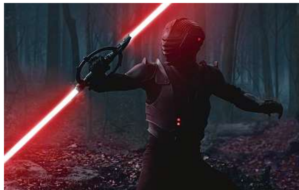
Ahsoka a generálka Hera Syndulla cestují do loděnic Nové republiky, kde učiní nečekaný objev. A ten objev souvisí s tímhle pánem.

řádu Jedi vedoucí armádu republiky proti nové Separatistické armádě droidů. Rozdíl mezi animovanou sérií, která pod hlavičkou Hvězdných válek rovněž vznikla, je využití 3D animace. Jako první díl seriálu, takzvaný pilot, posloužil stejnojmenný animovaný snímek, který se v tuzemsku dočkal v roce 2008 premiéry v kinech.