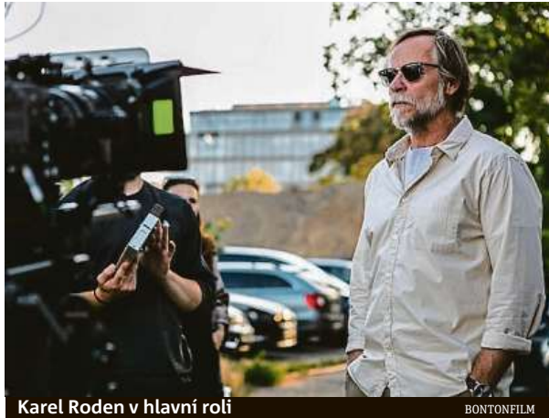
Karel Roden v hlavní roli