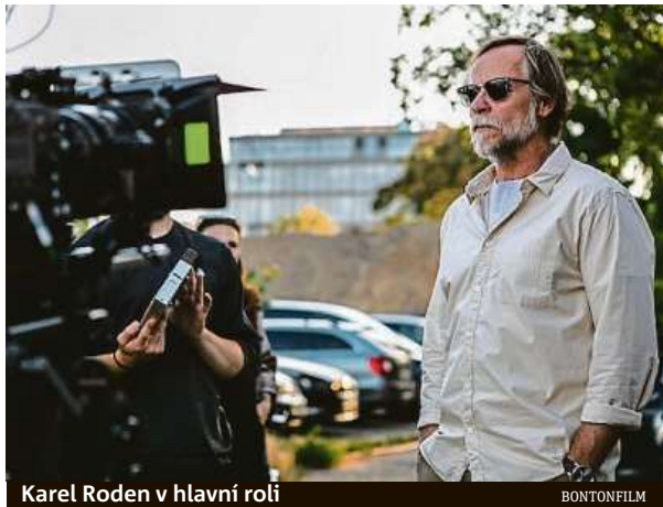
Karel Roden v hlavní roli