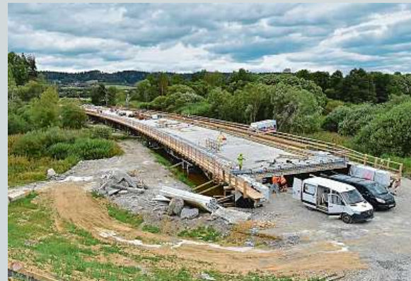
Pojede se kolem Mariánských Lázní.