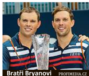
Bratři Bryanovi

Slavný tenisový pár Mike a Bob Bryanovi ukončil ve 42 letech kariéru.