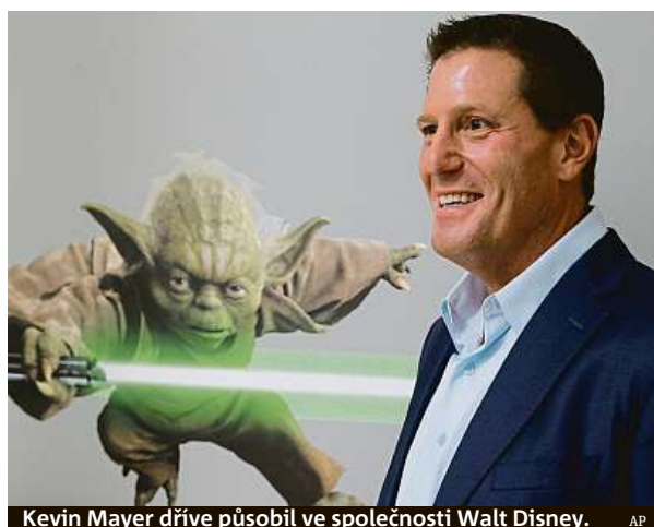
Kevin Mayer dříve působil ve společnosti Walt Disney.

Mayer v dopise zaměstnancům uvedl, že se rozhodl rezignovat poté, co se politické prostředí prudce změnilo. Do čela TikToku se postavil začátkem letošního června, předtím působil v americké mediální a filmové společnosti Walt Disney.