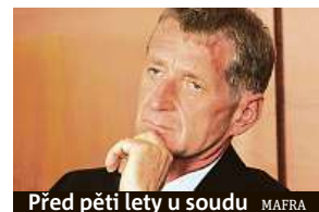
Před pěti lety u soudu

ličej a účelově mění vozidla,“ doplnili soudci. S tvrzením zprávy nesouhlasí Janouškův právník Lukáš Trojan, který i nadále tvrdí, že kdysi vlivný muž v Praze trpí nevyčlepnou nemocí. Nyní se čeká na termín dalšího řízení. ČTK