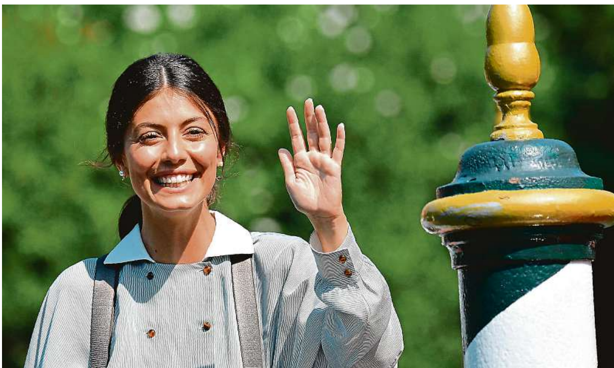
V Benátkách dnes startuje další ročník filmového festivalu. Na snímku je italská herečka Alessandra Mastroradiová.

Praha. Nejvíce expatů bydlí v hlavním městě, každý sedmý Pražan je cizinec. Boleslav a Kolín. Zahraniční pracovníky potřebují především automobilky. Evropa. Nejméně cizinců žije v Rumunsku a Litvě STRANA 3