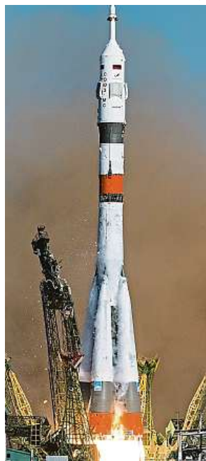
Vesmírná loď Soyuz MS-14

Vesmírný koráb Soyuz MS-14 zakotvil u Mezinárodní vesmírné stanice. Až napodruhé.