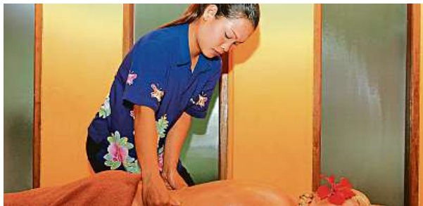
Na jednoho Thajce je v Česku 24 Thajek.