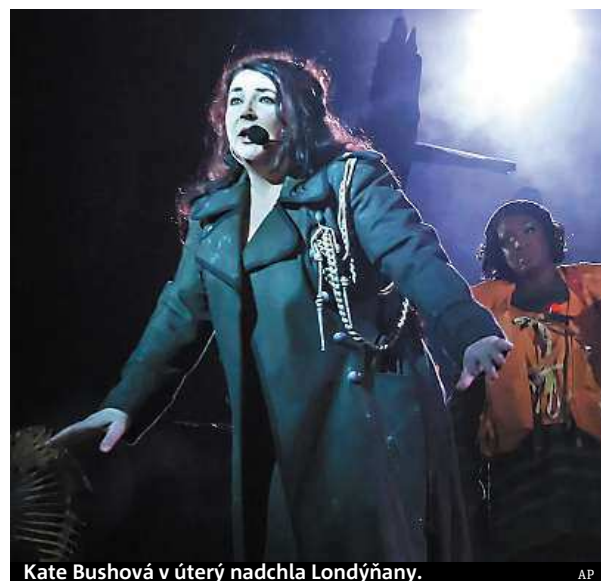
Kate Bushová v úterý nadchla Londýňany.