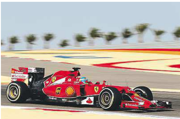
Fernando Alonso s Ferrari při Velké ceně Bahrajnu