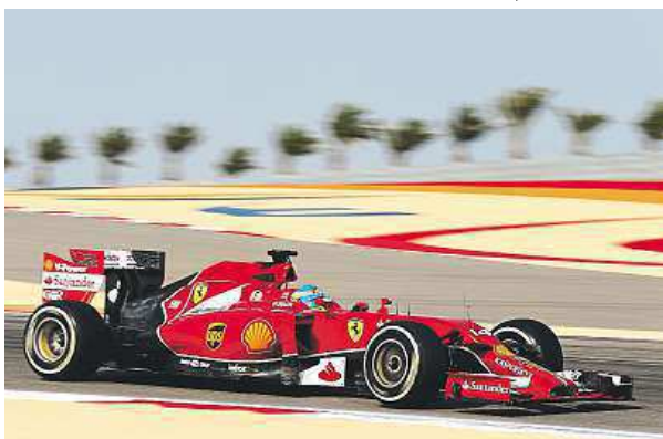
Fernando Alonso s Ferrari při Velké ceně Bahrajnu