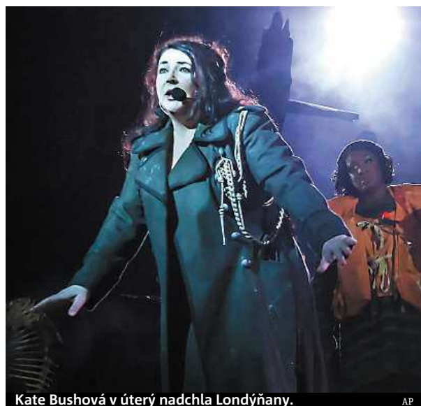
Kate Bushová v úterý nadchla Londýňany.