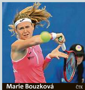
Marie Bouzková

Čtvrtfinalistka letošního Wimbledonu Marie Bouzková porazila v českém souboji na Livesport Prague Open krajanku Dominiku Šalkovou jasně 6:1, 6:2 a za 73 minut si zajistila jako první Češka postup do čtvrtfinále turnaje v pražské Stromovce.