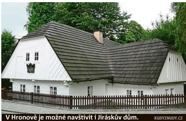
V Hronově je možné navštívit i Jiráskův dům.

Oficiální zahájení je naplánováno na tuto sobotu ve 14.15 na náměstí Čs. armády,