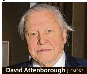
David Attenborough

Pradávný predátor patřil do skupiny, která nyní zahrnuje i korály, medúzy a sasanky. Obtisk jeho 20 centimetrového těla se uchoval