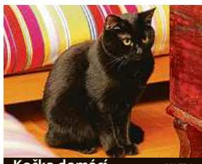
Kočka domácí

Polský Ústav pro ochranu přírody (PUOP) pak na svých internetových stránkách připomíná, že kočka zdomácněná teprve před deseti tisíci lety, a to na Blízkém východě. „Proto z čistě vědecké perspektivy na území Evropy,