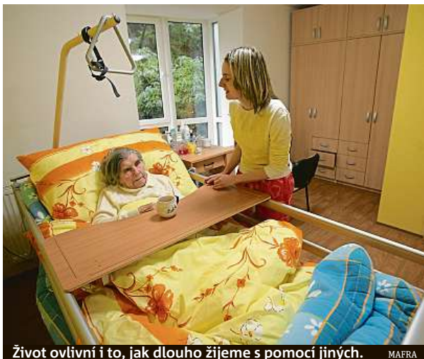
Život ovlivní i to, jak dlouho žijeme s pomocí jiných.

Miroslav Zikmund a Meda Mládková. Co tyto osobnosti spojovalo? Ve vysokém věku nedlouho před stovkou byli fyzicky a psychicky aktivní.