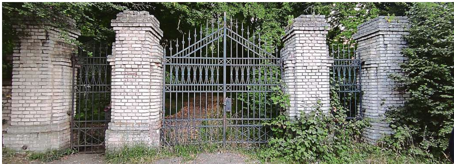
Vstupní brána na starý bohnický hřbitov se bude brzy celá rekonstruovat.