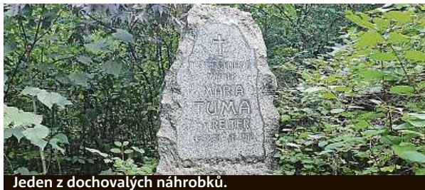
Jeden z dochovalých náhrobků.

Hrobů je tu přes čtyři tisíce. Leží v nich děti, které se