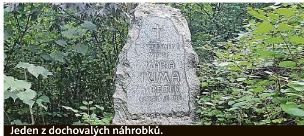
Jeden z dochovalých náhrobků.

Hrobů je tu přes čtyři tisíce. Leží v nich děti, které se