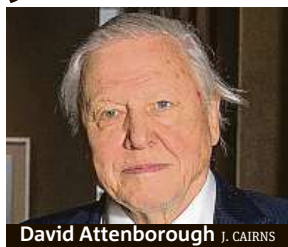
David Attenborough

Pradávný predátor patřil do skupiny, která nyní zahrnuje i korály, medúzy a sasanky. Obtisk jeho 20 centimetrového dlouhého těla se uchoval