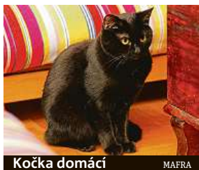
Kočka domácí MAFRA

Polský Ústav pro ochranu přírody (PUOP) pak na svých internetových stránkách připomíná, že kočka zdomácněla teprve před deseti tisíci lety, a to na Blízkém východě. „Proto z čistě vědecké perspektivy na území Evropy,