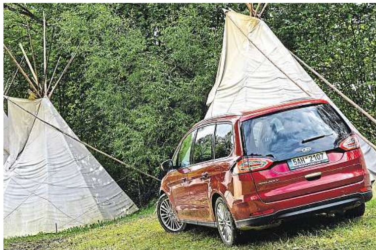
Kdyby měli galaxy indiáni, dali by mu jméno: Ten, co uveze sedm svišťů.