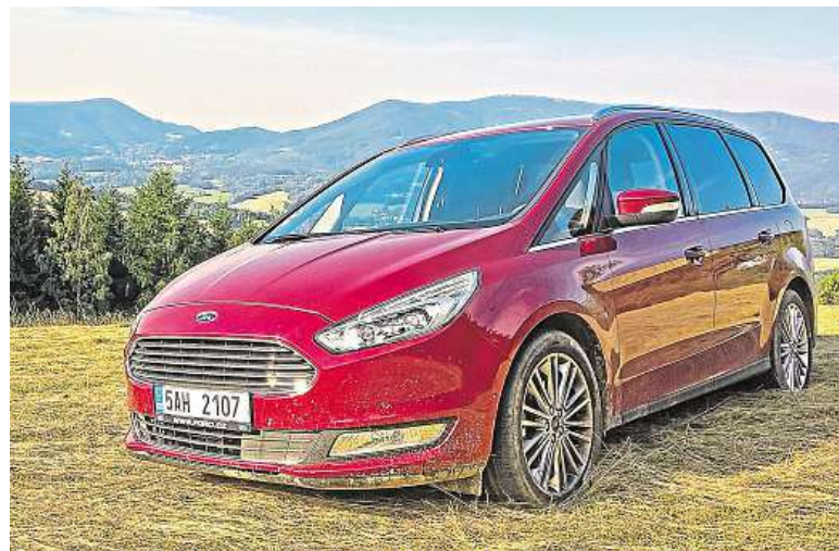
Díky AWD se už nemusíte bát vjet ani na podmáčenou louku.