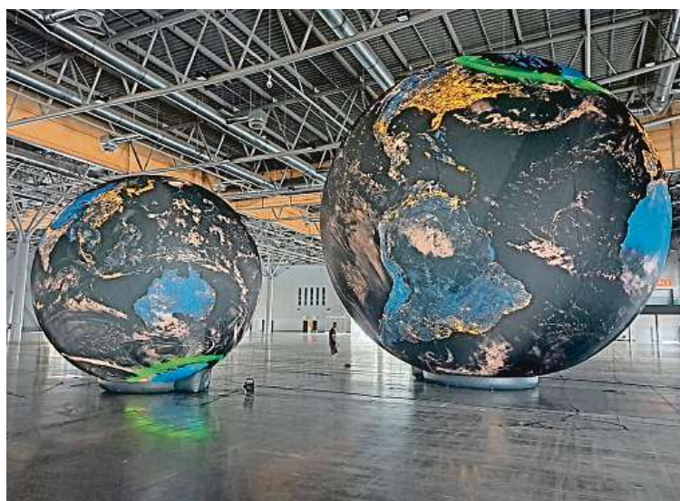
Už 1. srpna se do parku na Kraví hoře na týden vrátí spolu s Temnalónou (na snímku) také další předchozí modely – Lunalón, Marsmeloun a Heliosféra. KUBÍČEK VISIONAIR

sel nejprve zpracovat data a vytvořit technickou konstrukci. Nejvíce práce si vyžádalo samotné šití planety, nad nímž švadlenka strávila téměř třicet hodin. Poté bylo potřeba plátno ještě ručně nastříhat,“ popisuje Karel Urban z firmy. Podle něj se mají návštěvníci festivalu na co těšit. A to za každého počasí, protože látka je velmi odolná. Modely zvládnou i bouřku, uchycení vydrží náporu větru až do rychlosti 15 metrů za sekundu. MAP