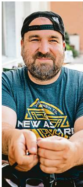
Zvonek nabízí akci s charitativním přesahem.

Karpaty fest má již mezi umělci své jméno, vědí o nás a hlavně vědí, že se o ně královsky postaráme.