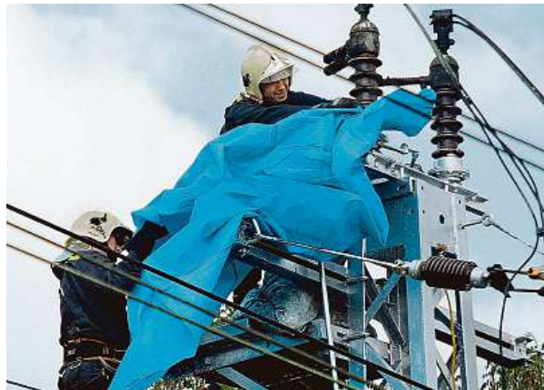
Proud zabíjel, i když se nedotkl drátů. Osmnáctiletý dělník natíral stožár u železniční trati. Blízkost drátů se mu stala osudnou.

„Počet úrazů v práci, i těch smrtelných, v posledních desetiletích významně klesl, firmy si pečlivě hlídají dodržování předpisů, montéři mají potřebné vybavení. Hlášení, kdy dojde k zasažení elektrickým proudem, se týká více situací v domácím prostředí nebo nepozornosti dětí a mladých lidí buď při zacházení se spotřebiči, nebo při riskantním chování,“ upozorňuje