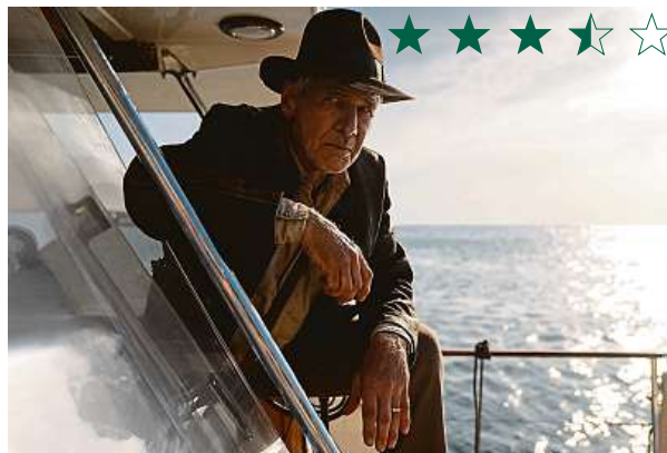
Harrison Ford oslaví 13. července narozeniny. Bude mu 81 let.

Indiana Jones a nástroj osudu, který jde zítra do kin, je nejdelším filmem z celé série, trvá přes dvě a půl hodiny. Přesto vám rychle uteče