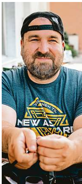
Zvonek nabízí akci s charitativním přesahem.

Karpaty fest má již mezi umělci své jméno, vědí o nás a hlavně vědí, že se o ně královsky postaráme.