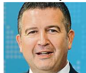
Jan Hamáček (ČSSD), ministerstvo vnitra, pověřen řízením ministerstva zahraničí