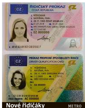
Nové řidičáky METRO