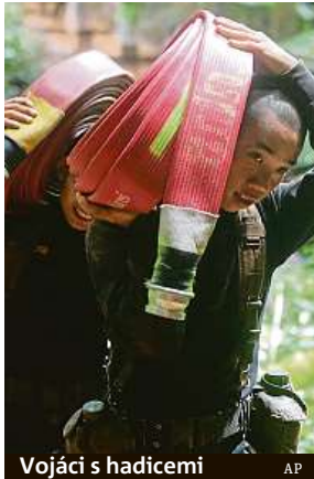
Vojáci s hadicemi

Záchranáři mezitím ke vchodu do jeskyně Tcham Luang dopravili další velké vodní hadice a pumpy. Potápěči vojenského námořnictva, kteří se snaží dostat do nitra jeskyně, uvedli, že na některých místech včera ráno stoupala voda rychlostí 15 centimetrů za hodinu. Ministr vnitra Anupong Paočinda v úterý