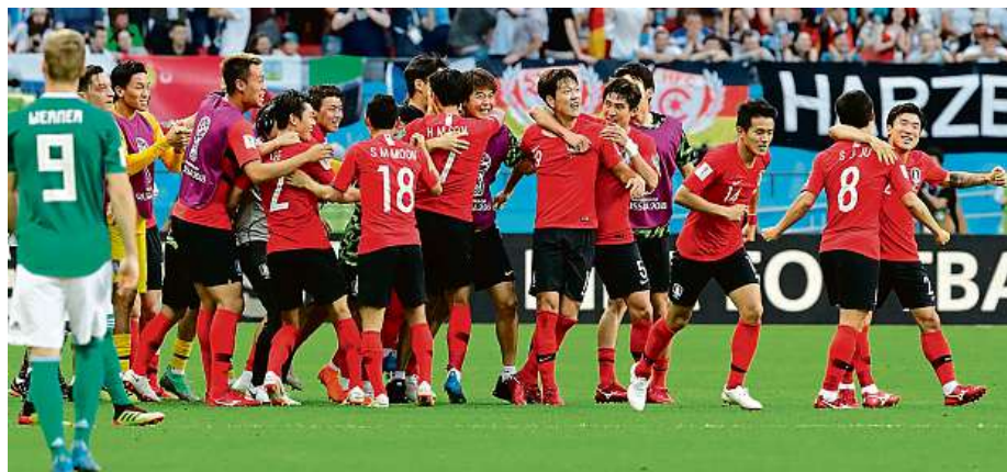
O zatím největší překvapení MS se postarali Korejci. Porazili mistry světa z Německa.