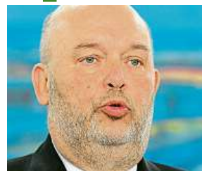
Miroslav Toman (ČSSD), ministerstvo zemědělství