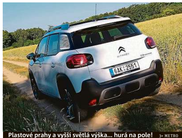
Plastové prahy a vyšší světlá výška... hurá na pole!