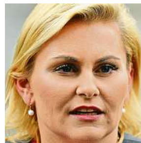
Taťána Malá (ANO), ministerstvo spravedlnosti

Šestařicetiletá Malá Vystudovala Panevropskou vysokou školu v Bratislavě, kterou Česká advokátní komora neuznává pro profesi advokáta. Vlastnila s manželem firmu působící v oblasti insolvenční a mikropůjček. Kvůli střetu zájmů svůj podíl proto převedla na manžela.