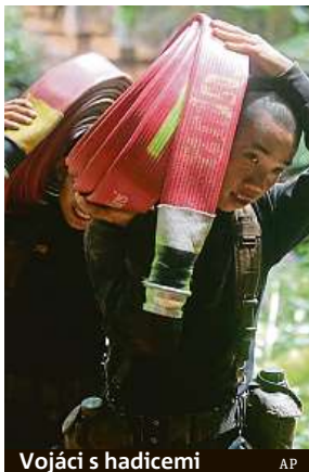
Vojáci s hadicemi

Záchranáři mezitím ke vchodu do jeskyně Tchang Luang dopravili další velké vodní hadice a pumpy. Potápěči vojenského námořnictva, kteří se snaží dostat do nitra jeskyně, uvedli, že na některých místech včera ráno stoupala voda rychlostí 15 centimetrů za hodinu. Ministr vnitra Anupong Paočinda v úterý