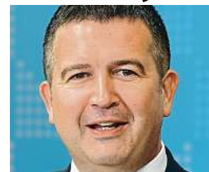
Jan Hamáček (ČSSD), ministerstvo vnitra, pověřen řízením ministerstva zahraničí