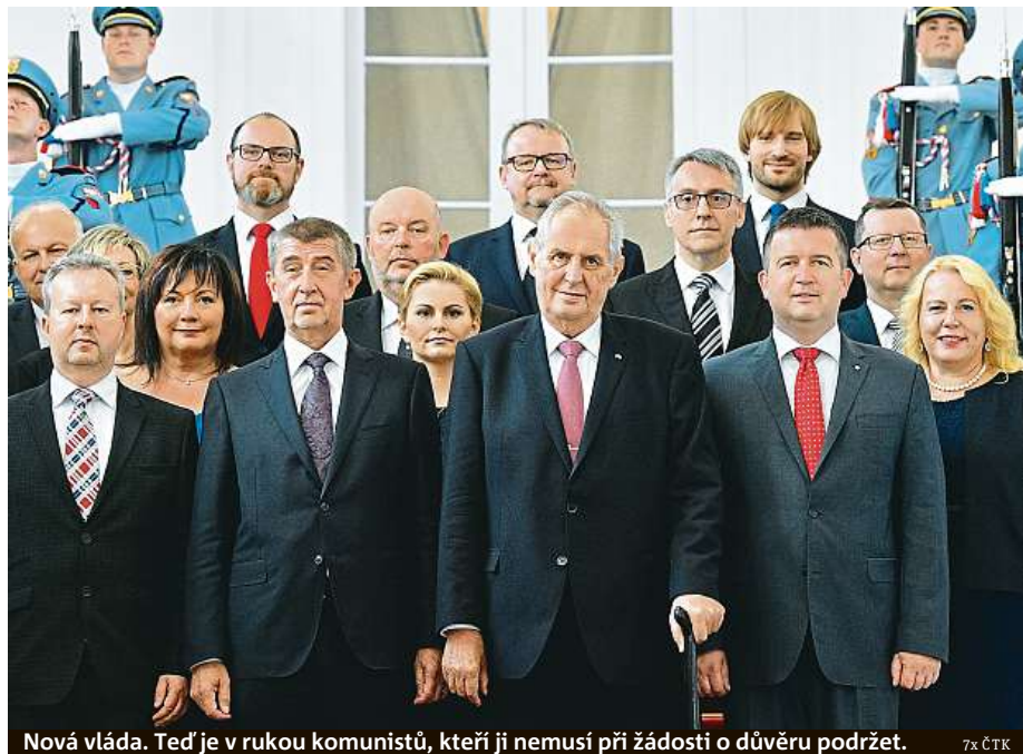
Nová vláda. Teď je v rukou komunistů, kteří ji nemusí při žádosti o důvěru podržet.