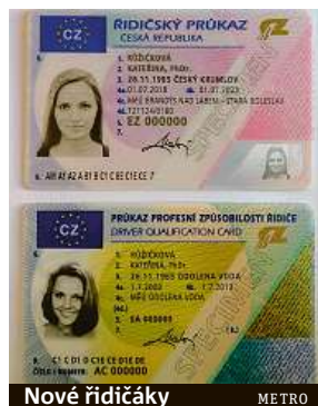
Nové řidičáky METRO