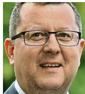
Antonín Staněk (ČSSD), ministerstvo kultury

Od května 2014 působí jako prezidentka Svazu obchodu a cestovního ruchu České republiky, je také místopředsedkyní Hospodářské komory ČR. Diváci si ji pamatují i z obrazovek České televize jako investorku v pořadu Den D.