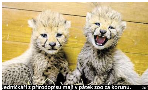
Jedničkáři z přírodopisu mají v pátek zoo za korunu. ZOO

• Malý dárek ve stylu filmu Transformers a zmrzlina čeká na prvních 300 školáků, kteří v pátek dorazí do OC Šestka.