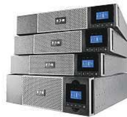
Záložní zdroj Eaton MIRONET

úroveň jednotlivých zařízení. Správce má také možnost nastavit a ovládat jednotlivé segmenty, aby se v případě potřeby odpojila méně důležitá zařízení a tím se prodloužila doba zálohování těch klíčových. Mezi neméně významné výhody patří i 99% energetická účinnost, čímž zdroj přispívá k úspoře nákladů vynaložených na klimatizaci a spotřebu energie. Teď navíc ušetříte už při samotném nákupu – v největším českém IT e-shopu Mironet totiž Eaton 5PX 2200i RT2U pořídíte s příjemnou 20% slevou.