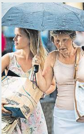
Bouřka v Praze

Ve středu teploty opět překonají 31 stupňů Celsia. Vedra odpoledne skončí s příchodem bouřky doprovázené silným větrem a krupobitím. Vítr může dosahovat rychlosti až devadesát kilometrů za hodinu. Pro několik míst v Česku dnes bude platit zvýšené riziko požárů. Ale jak budou bouřky postupovat z Čech směrem k východu, a na Moravu dorazí později odpoledne, budou výstrahy končit. IDNES.cz