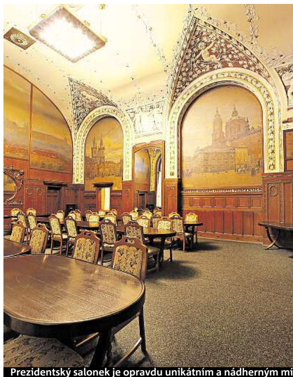
Prezidentský salonek je opravdu unikátním a nádherným místem.

Salonek je umístěn v jižním křídle nádražní budovy, která byla postavena na začátku 20. století podle návrhu architekta Josefa Fanty. Stejně jako celá budova byl vyzdoben ve stylu secese. ČTK