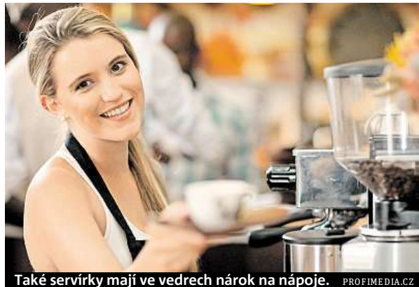
Také servírky mají ve vedrech nárok na nápoje.

Za minimální množství ochranného nápoje platí 1,5 litru na osobu na jednu směnu, při extrémních venkovních podmínkách je to až 2,5