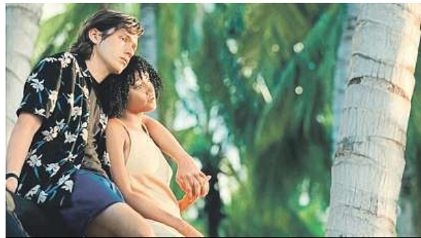
Nick Robinson a Amandla Stenbergová

V romantickém dramatu hrají v hlavních rolích Amandla Stenbergová a Nick Robinson.