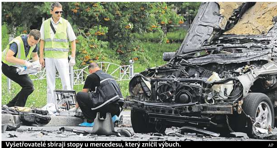
Vyšetřovatelé sbírají stopy u mercedesu, který zničil výbuch.

Atentát se podle ministerstva vnitra vyšetřuje jako teroristický čin. „Je zjevné, že na místě explodovalo výbušné zařízení,“ uvedl mluvčí ministerstva vnitra a dodal, že na místě činu sbírají stopy kriminalisté. Případ vzhledem k tomu, že se obětí stal voják, nejspíše převezme vojenská prokuratura. Při výbuchu byl podle mluvčího lehce zraněn kolemjdoucí muž ve vysokém věku, které-