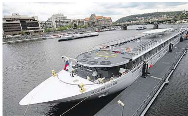
Největší říční loď byla v Praze poprvé loni v dubnu.

Zvýšení mostů však potěší nejen obří vodní hotely. Například loď Pivovar, na které je, jak napovídá název, restaurace