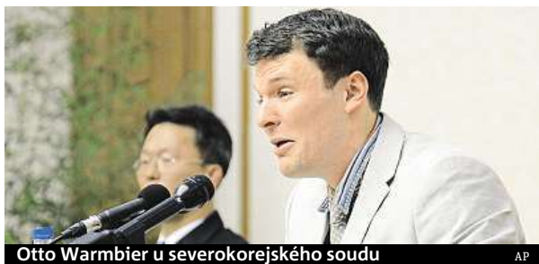
Otto Warmbier u severokorejského soudu

Podle americké profesorky byl Otto Warmbier člověk, který myslel, že mu vše projde.