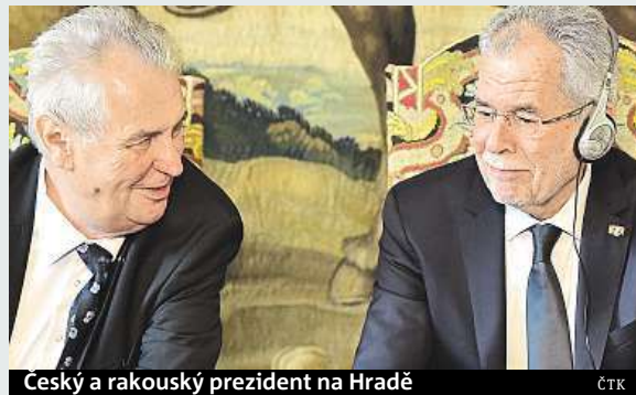
Ceský a rakouský prezident na Hradě