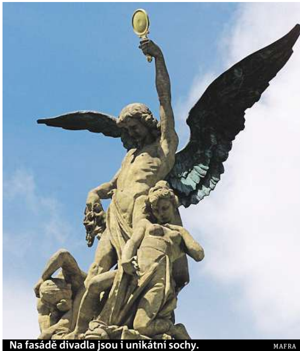
Na fasádě divadla jsou i unikátní sochy.

viště také k rekonstrukci budovy. Podle Wolfa by mohla stát kolem 700 milionů korun. „Je třeba opravit v podstatě vše – od sociálního zařízení přes výzdobu včetně fresek až po fasádu,“ uvedl Wolf. čtk