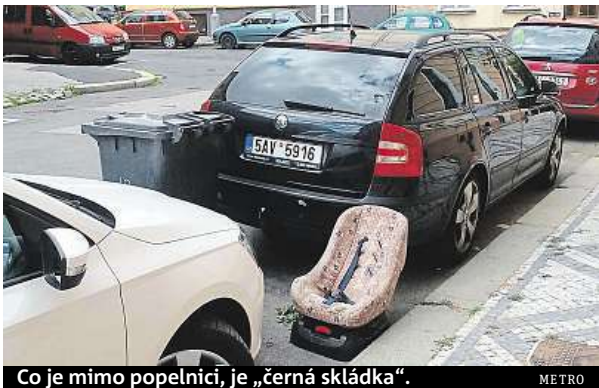
Co je mimo popelnici, je „černá skládka“.

„Není to poprvé, co někdo z místních musel po někom něco u popelnic uklízet. Nedávno šlo třeba o bojler, který tu někdo nechal. Ani sedačku ale neodvezli, jen ji šoupli blíž k chodníku. To nemají povinnost vyvézt vše kolem?“