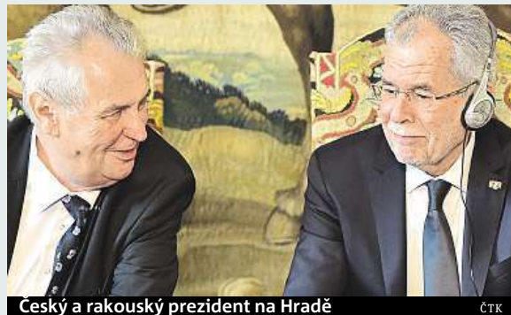
Ceský a rakouský prezident na Hradě