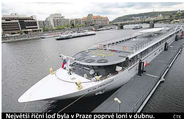
Největší říční loď byla v Praze poprvé loni v dubnu.

Zvýšení mostů však potěší nejen obří vodní hotely. Například loď Pivovar, na které je, jak napovídá název, restaurace