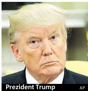
Prezident Trump

Oblíbenost USA v zahraničí byla na konci Obamova mandátu po osmi letech prezidentování na úrovni 64 procent, nyní je na 49 procentech, což je pokles o pět procentních bodů. Mnohem strmější pád