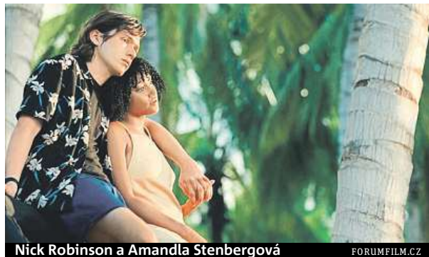
Nick Robinson a Amandla Stenbergová

Její negativní přístup k životu se začíná měnit v okamžiku, kdy se do vedlejšího domu nastěhují noví sousedé. Jak může Olly, kluk odvedle, změnit život dívky, která nikdy nezažila žádné dobrodružství?