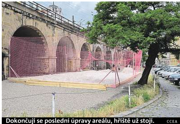
Dokončují se poslední úpravy areálu, hřiště už stojí. CCEA

Souvisí to s plánovanou rekonstrukcí Negrelliho viaduktu. Pod mostem jsou úžasné prostory a my chceme ukázat, že tahle místa pod druhým nejstarším mostem v Praze lze využít lépe než