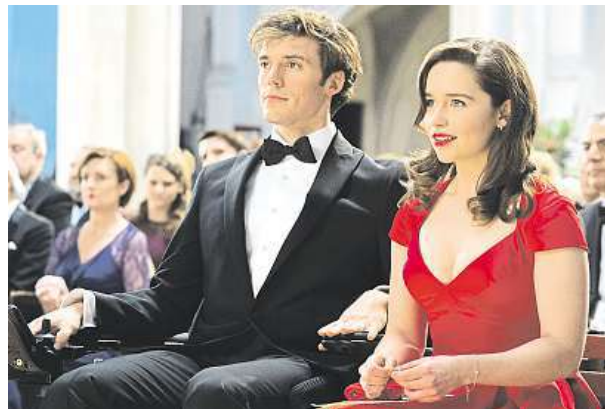
Ve filmu hrají Emilia Clarková a Sam Claflin.

Pojednává o mladé Louise Clarkové, která ví, že se jí líbí práce v bistro, a také ví, že možná nemiluje svého přítele Patricka. Zato neví nic o klasické hudbě, neví, že přijde o místo, a kdyby tušila, co ji čeká, asi by tomu stejně nevěřila. Will zase po dopravní nehodě ztratil chuť do života. Ví, čím byl kdysi, a všechno se mu nyní zdá nepodstatné,