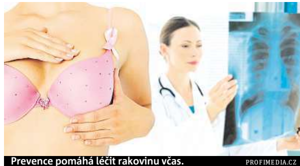
Prevence pomáhá léčit rakovinu včas.

Taková nádorová predispozice (poškozený gen) je většinou ve všech buňkách těla. Při vzniku pohlavních buněk dochází k tomu, že do poloviny z nich se dostane zdravý gen a do druhé poloviny ten poškozený. Tak se poškozený gen dědí do dalších generací. Teoreticky mutaci dostane polovina potomků.