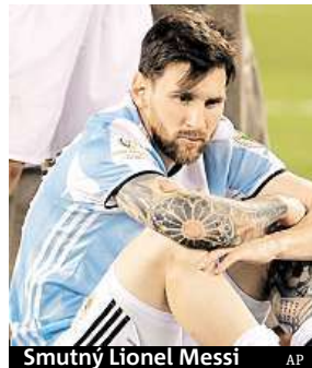
Smutný Lionel Messi

Argentinská fotbalová reprezentace zůstane po prohře ve finále Copa América s Chile už bez Lionela Messiho.