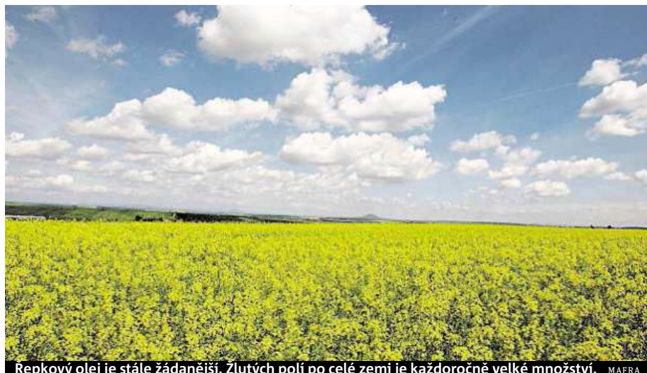
Řepkový olej je stále žádanější. Žlutých polí po celé zemi je každoročně velké množství. MAIRA

Na druhou stranu jsou nedílnou součástí fyziologických procesů organismu, jako je třeba syntéza hormonů.