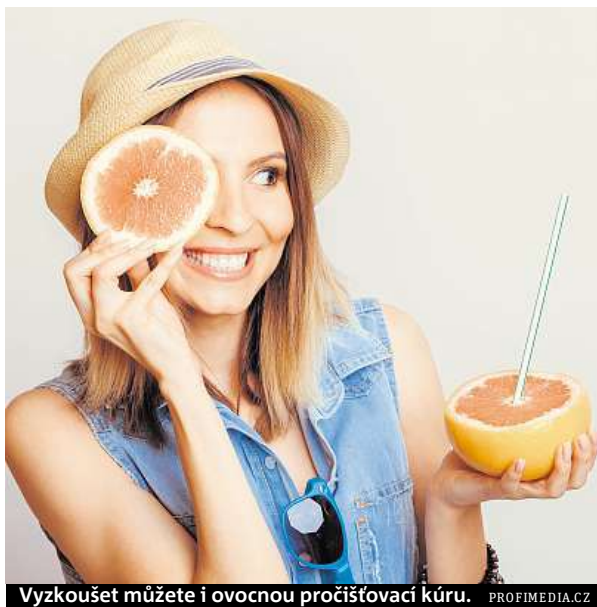
Vyzkoušet můžete i ovocnou pročistovací kúru.

Kartáčování pokožky je jedním z nejlepších způsobů, jak podpořit lymfatický