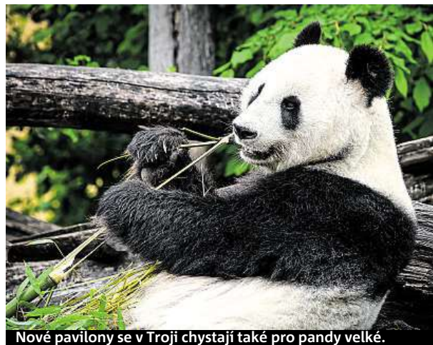
Nové pavilony se v Troji chystají také pro pandy velké.

Stěhovat se budou lední medvědi. Právě na místě jejich starého medvědice vy-