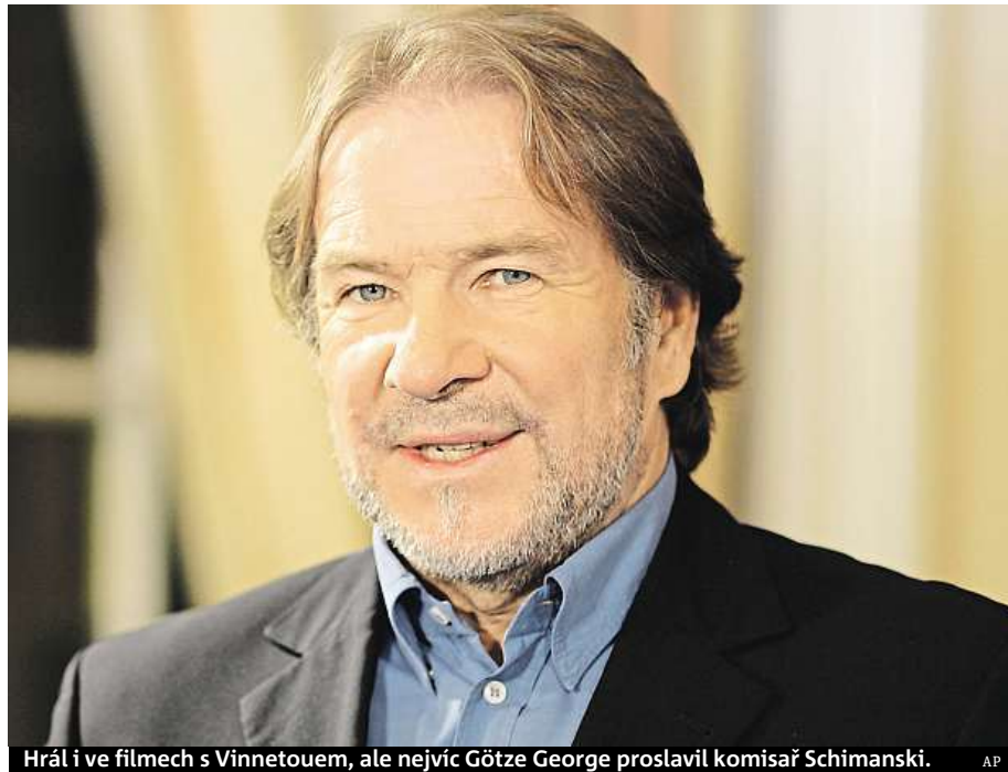
Hrál i ve filmech s Vinnetouem, ale nejvíc Götze George proslavil komisař Schimanski.

George se jako syn Heinricha Georgeho a Berty Drewsové mezi filmovými hvězdami pohyboval už od malička. Na jevišti divadla se poprvé objevil v roce 1950, od konce 60. let účinkoval v televizních kriminálních seriálech Komisař (Der Kommissar) a Místo činu. Před kamerou se naposledy objevil loni při natáčení kriminálního dramatu Špatné počasí (Böse Wetter) německé veřejnoprávní televize ARD.