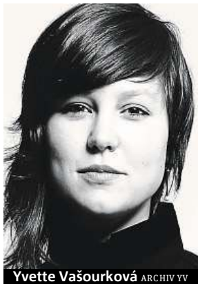
Yvette Vašourková ARCHIV YV

Předěláváme parkoviště pod viaduktem na veřejný prostor s relaxační letní zónou. Bude zde možnost si zahrát na hřišti plážový volejbal, to bude asi největší atrakce, ale bude tam i stolní tenis nebo trampolína. Otevře se zde bistro provozované známou karlínskou kavárnou Divoké matky, tančírna, pódium pro divadelní představení a koncerty, které zde budou jednou za čtrnáct dní. Vznikne tu tak prostor jak