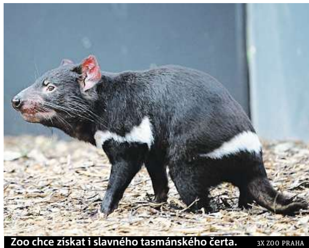
Zoo chce získat i slavného tasánského čerta.