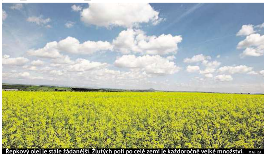
Řepkový olej je stále žádanější. Žlutých polí po celé zemi je každoročně velké množství.

Na druhou stranu jsou nedílnou součástí fyziologických procesů organismu, jako je třeba syntéza hormonů.