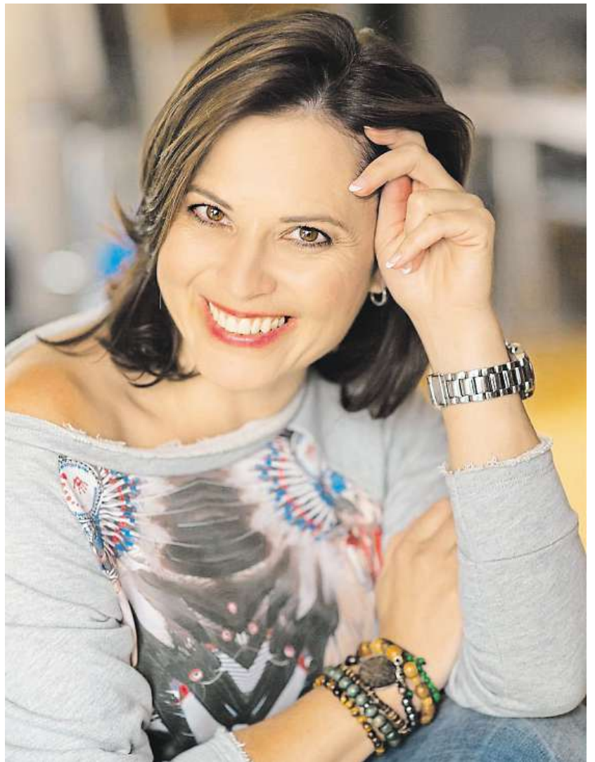
Klientkou centra je i herečka Bára Kodetová.