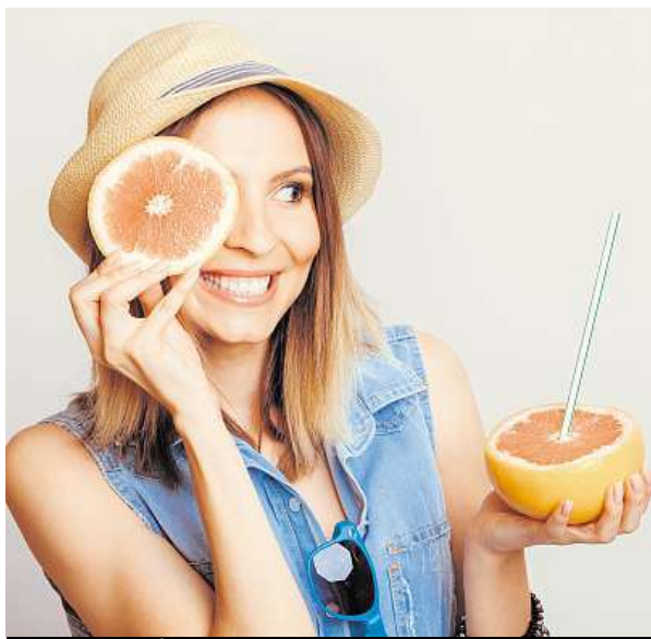
Vyzkoušet můžete i ovocnou pročistovací kúru.

Kartáčování pokožky je jedním z nejlepších způsobů, jak podpořit lymfatický