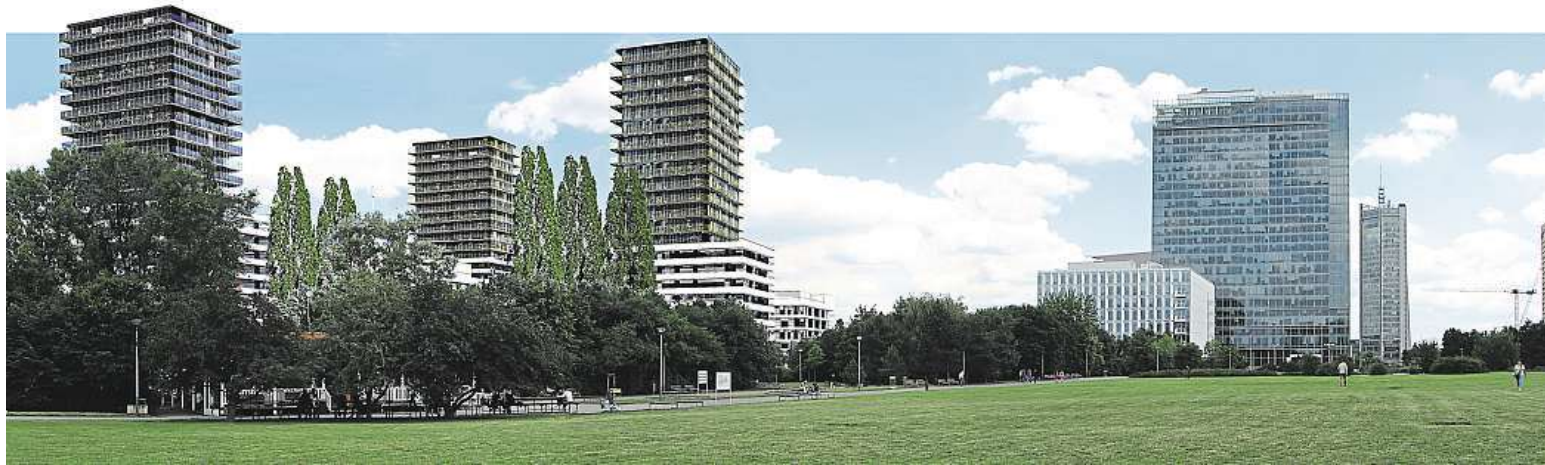
Tři sedmdesátimetrové domy mají změnit panorama pražské Pankráče.