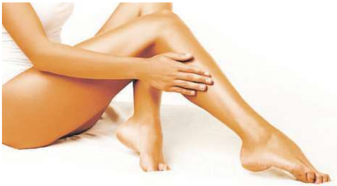
Samotný zákrok není časově nijak náročný.