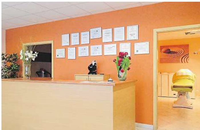
„Každá návštěva je pro mě relaxace,“ říká herečka Bára Kodetová.