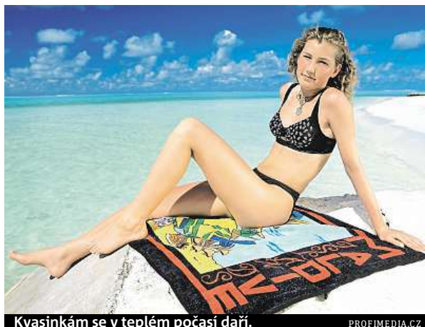
Kvasinkám se v teplém počasí daří.

v zavádění speciálních kapslí či tablet dovnitř vagíny, případně v aplikaci mastí na vnější podrážděnou část genitálu. U mužů se používá pouze mast. Pokud se infekce vrací nebo v preventivní léčbě je vhodné užívání probiotik k navození přirozené rovnováhy vaginálního prostředí.