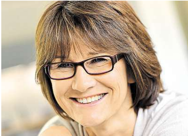
V menopauze i po ní můžete být šťastní.

Menopauza u spousty žen vyvolává negativní emoce. Je ale potřeba na přechod, tedy trvalou ztrátu menstruace, nahlížet jen s obavami?