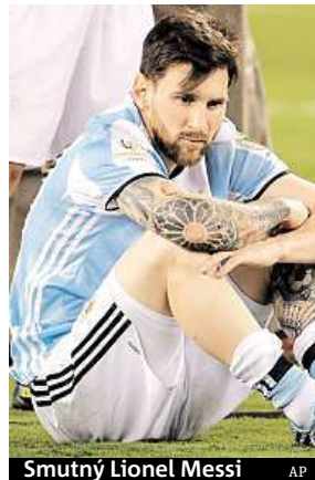
Smutný Lionel Messi

Argentina se s Chile potkala ve finále Copa América po roce. Stejně jako loni nepadl gól v normální hrací době ani v prodloužení. A tak musely v americkém East Rutherfordu rozhodnout až penalty, které Chileané vyhráli 4:2. A co hůř, Messi byl jedním z neúspěšných exekutorů. Po zápase v emocích uvedl, že dres národního týmu už neoblékne. „Už jsem hrál čtyři finále, zřejmě mi to není souzeno. Snažil jsem se, co to šlo. Strašně jsem ten titul pro Argentinu chtěl, ale nedokázal