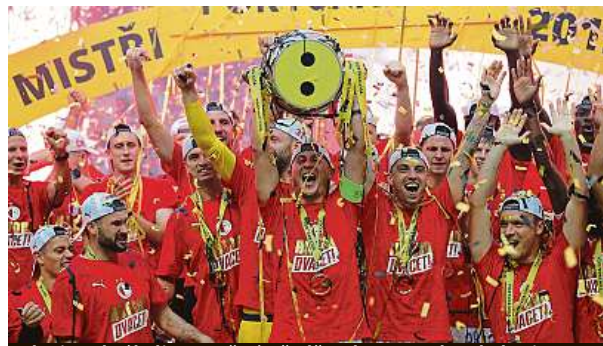
Slavia vyhrála ligu potřetí v řadě, taktó se radovala loni.