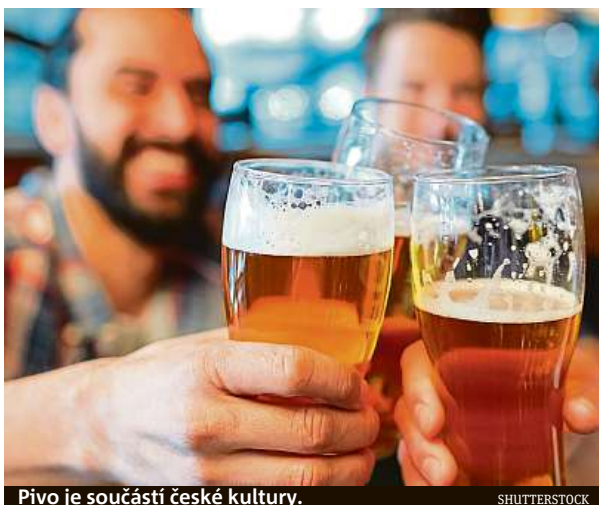
Pivo je součástí české kultury.

Postupně obnovilo provoz přibližně 22 tisíc hospod, bister a restaurací, co jich po Česku je, znovu se rozjíždějí tisíce výčepů a pív. Štamgasti zase zaujmou svá privilegia