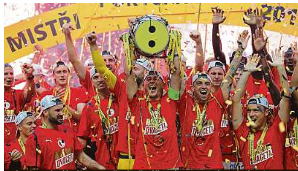
Slavia vyhrála ligu potřetí v řadě, takto se radovala loni.