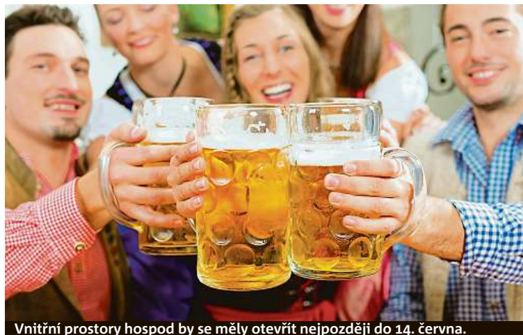
Vnitřní prostory hospod by se měly otevřít nejpozději do 14. června.

V neposlední řadě z vás pivo udělá fešáka. Jedním z jeho méně očekávaných a zmiňovaných přínosů je totiž zářivější úsměv. Chmelový nápoj totiž bojuje v našich ústech proti bakteriím, které způsobují kaz nebo zánět dásní. Látky v něm obsažené zpomalují jejich růst. V tomto případě ale platí rada: nekombinovat s cigaretami. Kouření na zubech časem zanechává fleky. FILIP JAROŠEVSKÝ