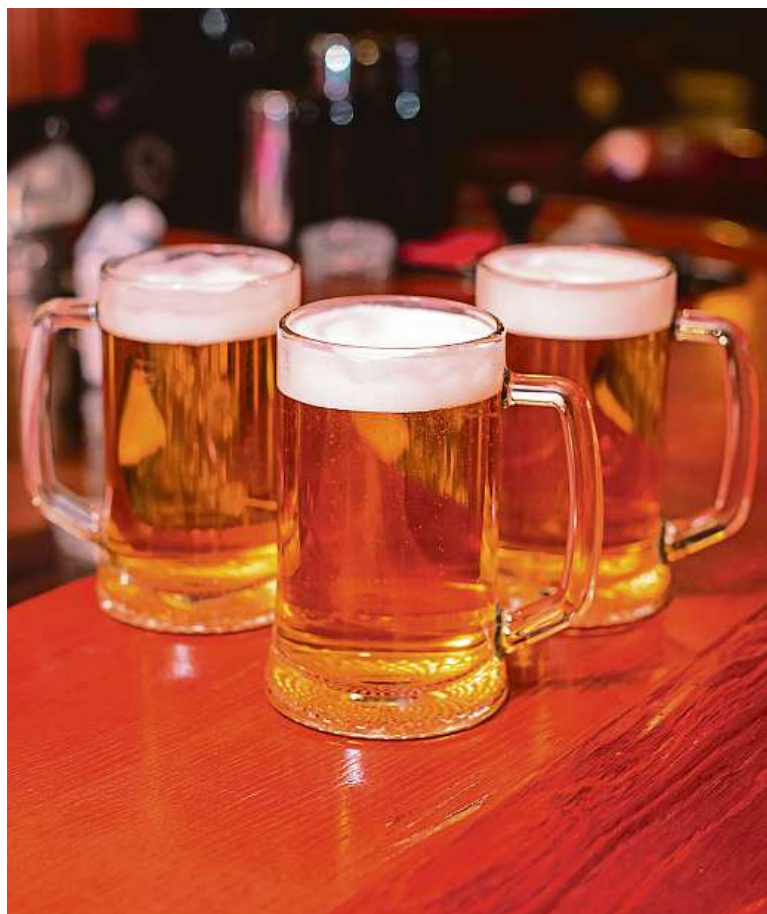
Už jste si zašli na zahrádku své oblíbené hospůdky na pár kousků?