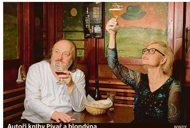
Autoři knihy Pivař a blondýna

A na konci minulého roku v nakladatelství Bondy vyšla kniha Pivař a blondýna. O pivu si v ní povídají advokátka, spisovatelka a kdysi také ministry-