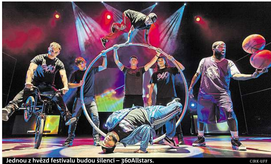
Jednou z hvězd festivalu budou šílenci – 360Allstars.