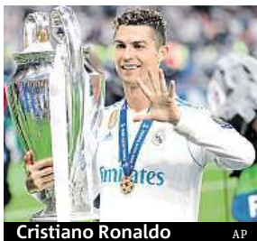
Cristiano Ronaldo

Real dostal do vedení po pauze Karim Benzema, když zachytil špatně vyhození brankáře Lorise Kariuse. Rychle srovnal Sadio Mané, ale v 64. minutě se krásně trefil nůžkami Gareth Bale a stejný hráč