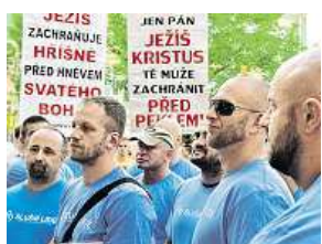
Protesty v Brně