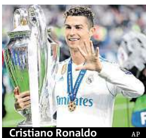
Cristiano Ronaldo

Real dostal do vedení po pauze Karim Benzema, když zachytil špatně vyhození brankáře Lorise Kariuse. Rychle srovnal Sadio Mané, ale v 64. minutě se krásně trefil nůžkami Gareth Bale a stejný hráč