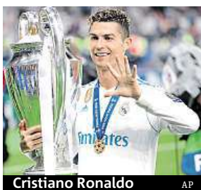
Cristiano Ronaldo

Real dostal do vedení po pauze Karim Benzema, když zachytil špatně vyhození brankáře Lorise Kariuse. Rychle srovnal Sadio Mané, ale v 64. minutě se krásně trefil nůžkami Gareth Bale a stejný hráč