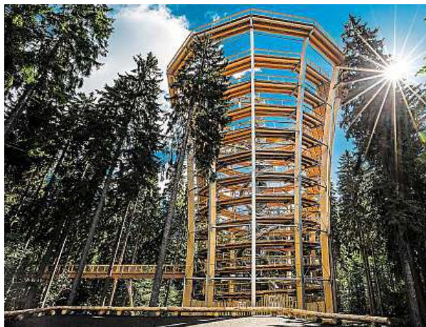
Stezka korunami stromů je známější atrakcí. Uplně nové tipy najdete v nových mapách.

KRNAP pak bude představovat další turistické cíle každý rok. Letos by větší pozornost mohla přitáhnout naučná stezka Černoohorského rašeliníště, krásné výhledy od Janských Lázních nebo tamní stezka korunami stromů, která pobaví ty méně klidnější turisty. MAREK PEŠKA