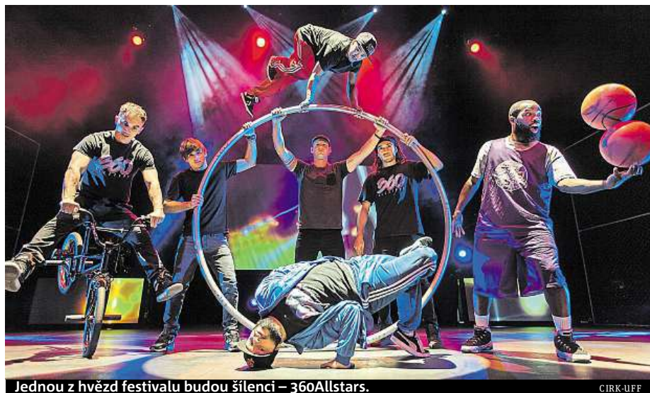
Jednou z hvězd festivalu budou šílenci – 360Allstars.