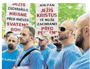
Protesty v Brně