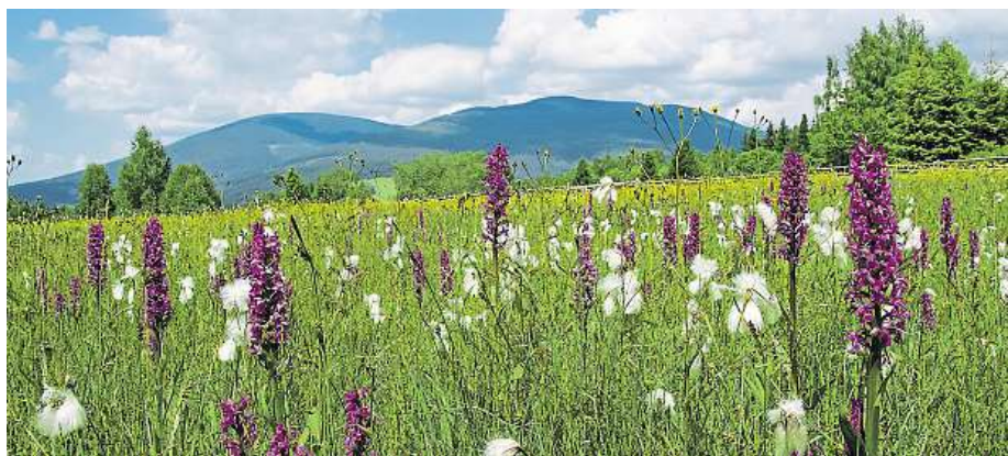
Navštívit můžete i Slunečnou strán u Svobody nad Úpou, kde rostou orchideje