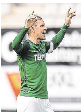
Hübschman z Jablonce ČTK

Poslední kolo fotbalové ligy rozluštilo všechny tajenky. Slavia udržela druhou příčku, nejlepším střelcem se stal Krmenčík z mistrovské Plzně.