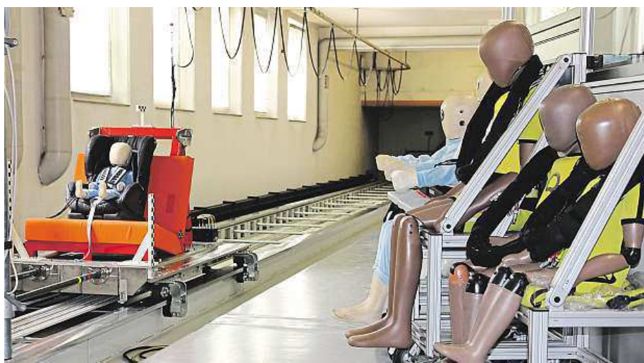
Crashtestem projdou různě velké a těžké figuríny.

Firma Britax, u nás známá spíš pod názvem Römer, tedy v Ulmu autosedačky nejen vyrábí, ale také testuje. „Naše testovací stroje dokážou automatizovaně ověřit trvanlivost, funkčnost a bezpečnost