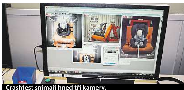
Crashtest snímají hned tři kamery.

buď jednotlivých prvků autosedaček, jako například pásů nebo mechanismu pro zacvaknutí a odepnutí pásů, nebo trvanlivost autosedačky jako celku,“ jmenuje některé