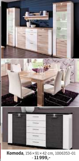
Komoda, 156 × 91 × 42 cm, 1006353-01 - 11 999,-