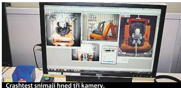
Crashtest snímají hned tři kamery.

buď jednotlivých prvků autosedaček, jako například pásů nebo mechanismu pro zacvaknutí a odepnutí pásů, nebo trvanlivost autosedačky jako celku,“ jmenuje některé