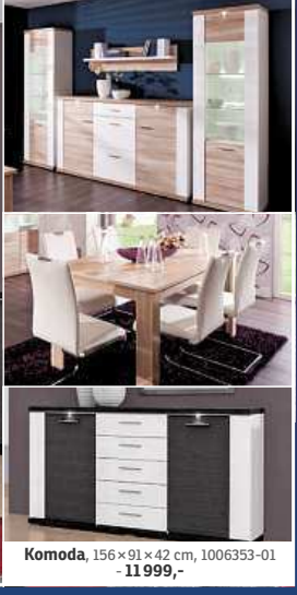
Komoda, 156 × 91 × 42 cm, 1006353-01 - 11 999,-