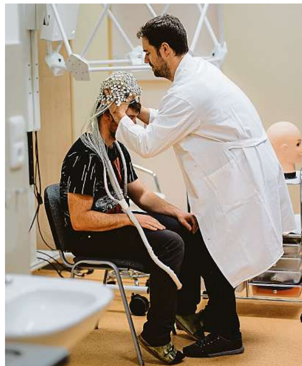
Výzkum psilocybinu při léčbě deprese