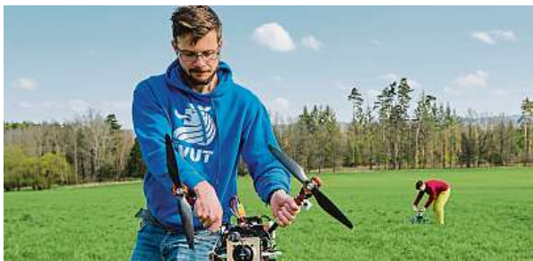
Drony zvládají zadané úkoly mnohem rychleji a levněji než člověk, třeba najít stromy napadené kůrovcem.

S milimetrovou přesností i za větru přistanou na jezdoucím autě, jejich roje koordinovaně sbírají předměty. Umějí také pomáhat lesníkům při detekci kůrovce.