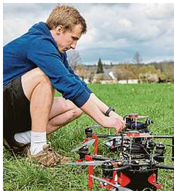
Drony využívají multispektrální kamery. 2x ČVUT