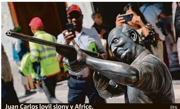
Juan Carlos lovil slony v Africe.

Dílo nazvané „Parazitické strategie pro přežití v krutém světě“ zesměšňovalo 85letého bývalého monarchu a naráželo na jeho vášeň pro lov velké zvěře. Chilský umělec po osmi minutách svou nepopulární sochu vysokou 170 centimetrů, vyrobenou