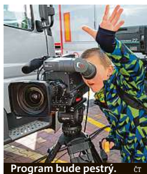
Program bude pestrý. ČT