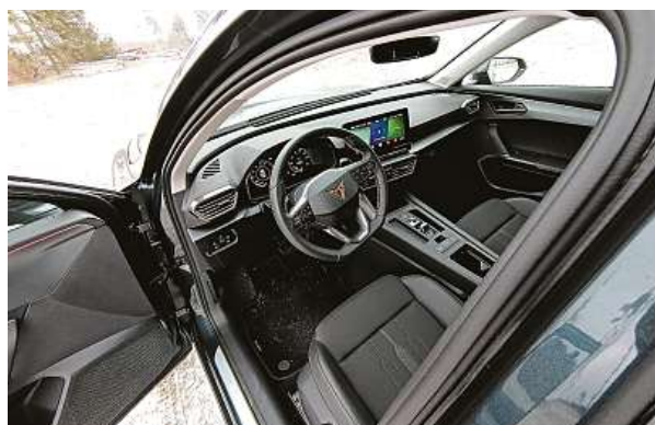
Čistý design, velká obrazovka infotainmentu

Nejdřív jsem si myslel, že patnáctistovka v tomto autě s „dravým“ chlapským stylem nemá smysl, ale ouha – začal jsem se na ně dívat jinak a vzal ho na nasazené. Vysočině i mimo silnice. Na dálnici se zprvu auto chovalo, jak bylo očekáváno – nijak přehnaně dynamická jízda, ale o to lepší spotřeba – během testu jsme jezdili za 6,5 litru na sto v průměru.