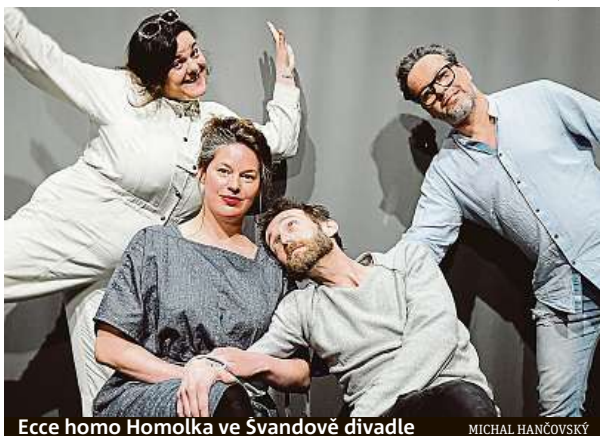
Ecce homo Homolka ve Švandově divadle

Rodina Homolkových společně vyráží na výlet do lesa. Bodrý suverén děda, přísně starostlivá babi, životem zklamaná Heduš, podpantoflák Ludva i zlobivá dvojčata si přírodu užívají. Ze sváteční idylky jsou však nepříjemně vyrušeni. Odehraje se zbytek dne ve znamení urputných há-