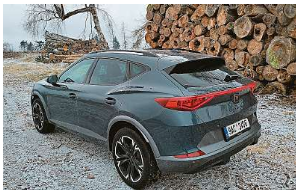
Zadní spojené lampy, to je poznávací znamení Formentora.