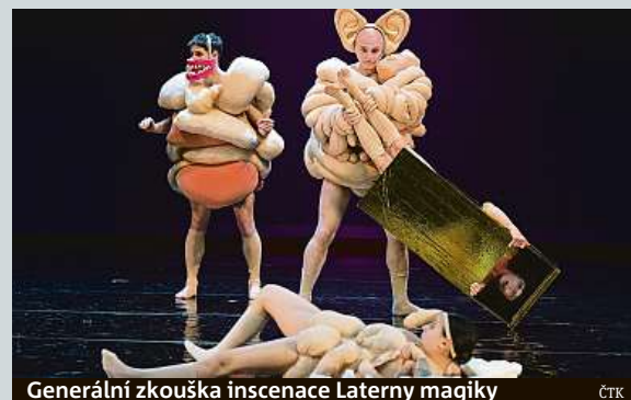
Generální zkouška inscenace Laterny magiky

Pražská Laterna magika uvede dnes premiéru inscenace inspirované tvorbou a životem Edgara Allana Poea. Mísí v sobě tanec, zpěv, výraznou scénografii i expresivně pojaté kostýmy, objekty či loutky. Pro inscenaci divadelníci oživili trik z 19. století, takzvaný Pepper's Ghost Effect, což byl předchůdce hologramu. Díky této iluzi, jejíž podstatou je odraz herce nasvíceného pod jistým úhlem, je na jevišti „duch“.