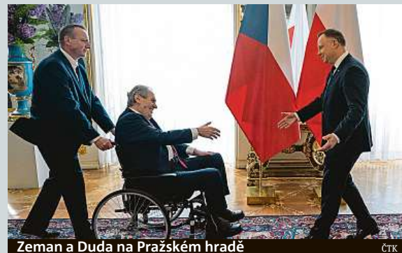
Zeman a Duda na Pražském hradě