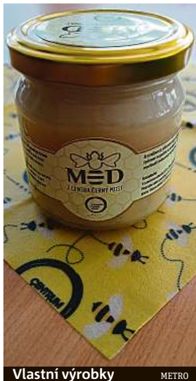
Vlastní výrobky METRO

Centrum Černý Most chce své zákazníky také inspirovat k ohleduplnějšímu přístupu k nakupování. K tomu slouží speciální microsite www.nakupyudrzitelne.cz , která je plná praktických návodů a tipů nejen na udržitel-