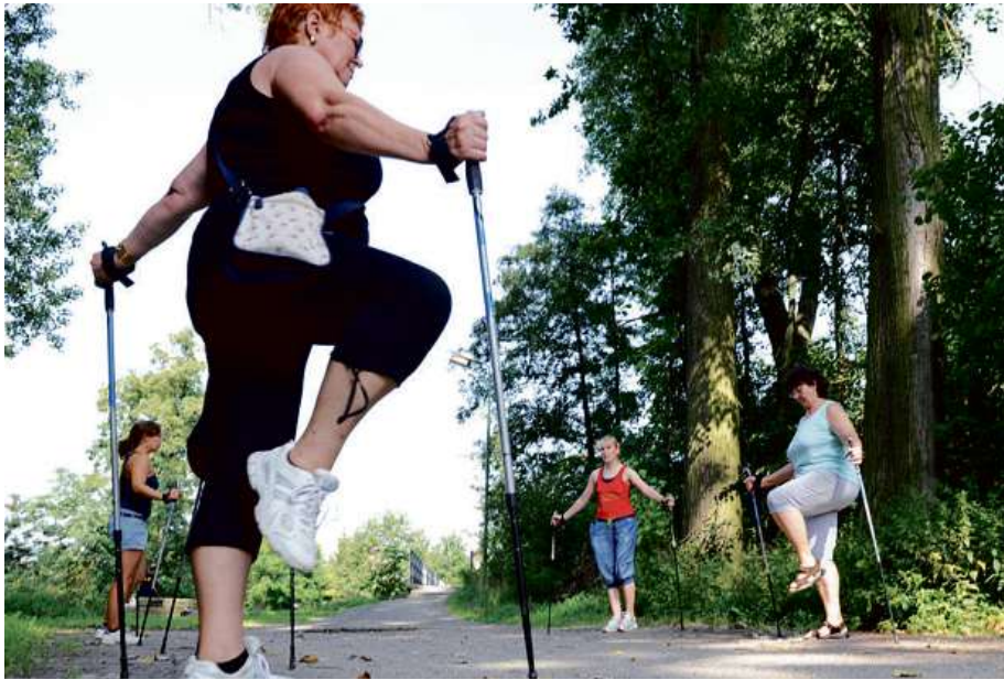
Lékárny Dr.Max spouštějí program post-covidové péče pod heslem „vraťte se zpátky do formy“

Odhady toho, kolik lidí zatím v Česku prodělalo covid, se značně liší. Kolísají mezi více než desetinou a třetinou obyvatelstva. Značné rozdíly jsou i mezi tím, jak se lidé nejen s nemocí během jejího přímého průběhu, ale i s jejími následky dokážou vyrovnat.