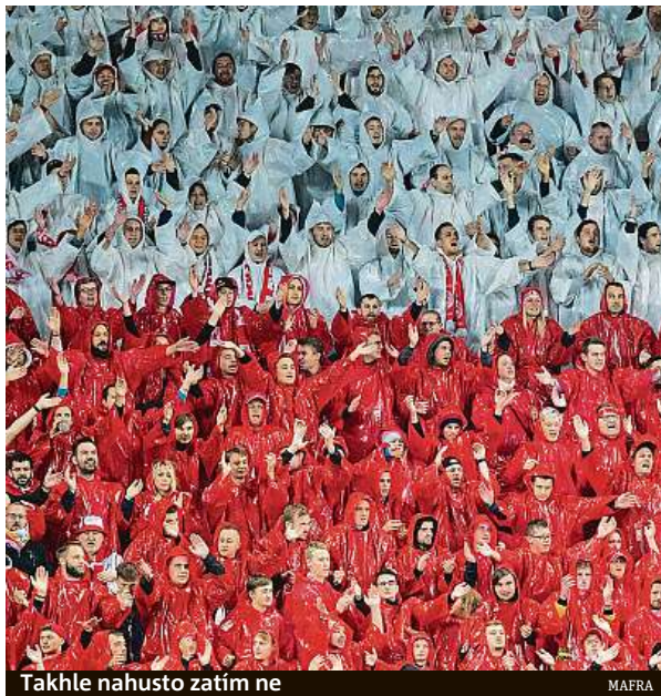
Takhle nahusto zatím ne

Poté byla nejvyšší soutěž kvůli covidu-19 na měsíc přerušena a po restartu se hrálo bez příznivců. Od první poloviny prosince mohlo na utkání nejvyšších soutěží ve fotbale a v hokeji 300 osob z řad partnerů klubu, později kvóta kvůli zhoršené epidemiologické situaci v zemi klesla na 200 lidí. Povolení z 10 procent zaplnit hlediště platí rovněž pro druhou ligu.