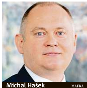
Michal Hašek

Náměstkem na ministerstvu vnitra se po odchodu Jakuba Kulhánka do čela diplomacie stal bývalý předseda Asociace krajů Michal Hašek. Oznámil to vicepremiér a ministr vnitra Jan Hamáček. Řekl, že bývalý první místopředseda ČSSD Hašek se nevrací do vo-