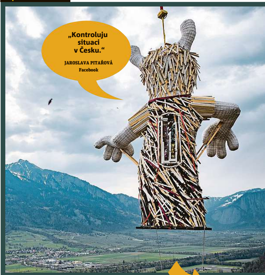
JAROSLAVA PITAŘOVÁ Facebook