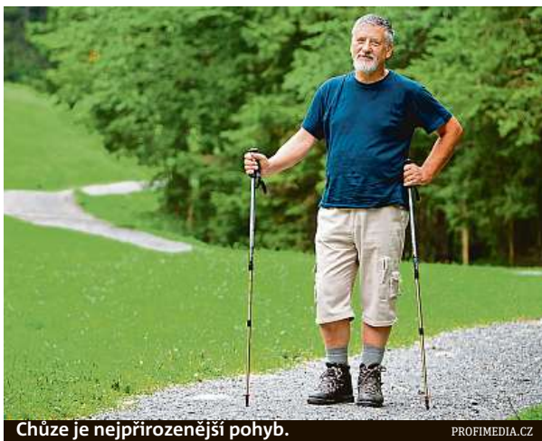
Chůze je nejpřírodnější pohyb.

Kolem padesátého roku života přichází u mnoha lidí zlom, kdy i vlivem hormonálních změn (zejména u žen) dochází k postupnému úbytku množství svalové hmoty a přibývání tkáně tukové. Tento proces je do jisté míry