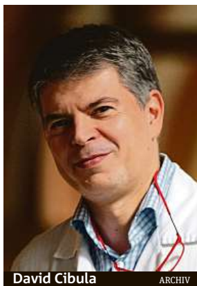
David Cibula ARCHIV

U většiny pacientek příčinu neznáme. Víme, že mezi ochranné faktory, které riziko celoživotně snižují, patří těhotenství, kojení nebo užívání kombinované hormonální antikoncepce. Riziko ale není snížené tak výrazně, abychom mohli doporučit užívání antikoncepce v populaci jen z tohoto důvodu. Genetika má ale velký význam a stále se zvyšuje podíl žen, u kterých jsme schopni nalézt změnu genetického kódu, která onemocnění způsobila. Až u jedné třetiny pacientek s karcinomem vaječníků pak onemocnění vzniká na základě vrozené dispozice, která se v rodině přenáší z generace na generaci. Nejčastěji jde o mutace genů BRCA1 a BRCA2. Nositelé