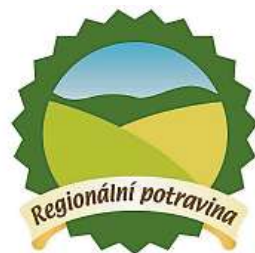
Logo značky SZIF.CZ

Když výrobce značku získá, zavazuje se udržet nad-