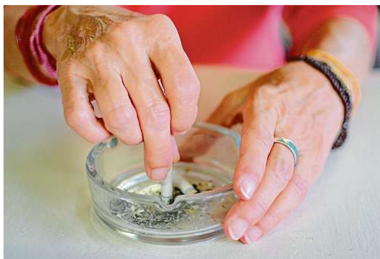
Kouření může zvyšovat i rozvoj demence.