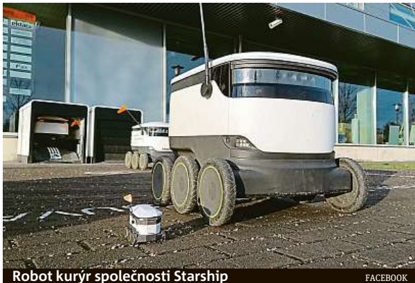
Robot kurýr společnosti Starship

Ale od 23. března, kdy vláda zavedla přísná pravidla společenského odstupu, mají tyto pomocníci více napílno. Nyní v první řadě zdarma doručují nákupy zaměstnan-