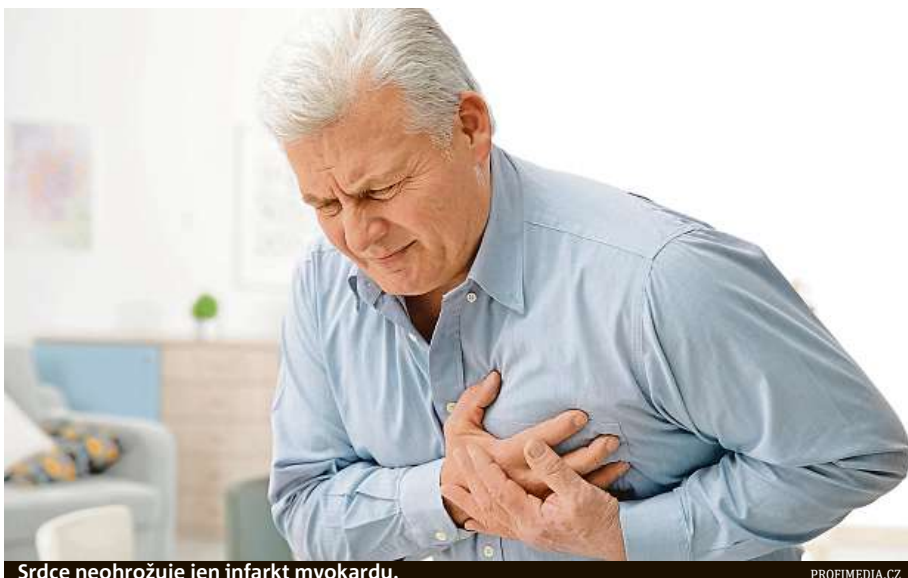
Srdce neohrožuje jen infarkt myokardu.

„Pozdní diagnóza znamená ve většině případů také horší vyhlídky do budoucna, nižší