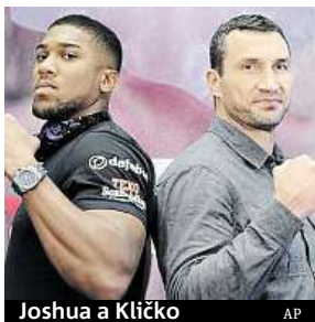
Joshua a Kličko

Odborníci i bookmakeři favorizují sedmadvacetiletého Joshuu, který po přechodu k profesionálům v roce 2013 všech 18 soupeřů nokoutoval, navíc jen dvakrát musel boxovat více než tři kola. Kličko se do ringu vrací poprvé od překvapivé porážky s Britem Tysonem Furyem předloni v listopadu, jež ukončila Ukrajincovu dlouholetou nadvládu v těžké váze. Chystanou odvetu Fury dvakrát odřekl, vzdal se titulů WBA i WBO a léčí se z depresí a zá-