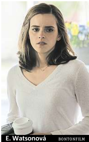
E. Watsonová

Do kin včera vstoupil film s Emmou Watsonovou jako mladou ambiciózní dívkou Mae a Tomem Hanksem, který ztvárnil vizionáře. The Circle je název snímku, ale stejně se jmenuje i nejlepší současná high-tech společnost, ve které neexistuje neřešitelný problém. Film byl natočen podle knižní předlohy. Do jaké míry je to utopie a do jaké tam opravdu směřujeme? Odpovídá přímo hlavní postava Emma Watsonová.