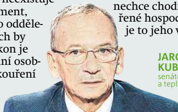
JAROSLAV KUBERA senátor a teplický primátor

se nám ztrácí mezi prsty. Navíc nevím, proč je nutné něco kuřákům nařizovat. Trh si sám našel svou cestu. Někam chodí gurmáni, co by jim kouření vadilo, nebo jsou vinotéky, kde se nekouří z důvodu, aby se nenarušovala chuť vína. To každý pochopí. Podniky se přece mohou rozhodnout samy, jestli budou kuřácké, či nikoliv. Pokud tedy někdo nechce chodit do zakouřené hospody, nemusí, je to jeho volba.