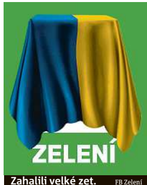
Zahalili velké zet. FB Zelení