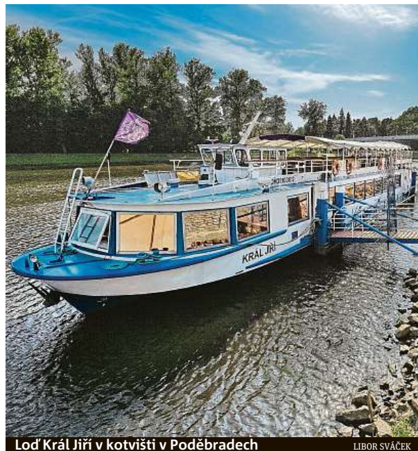
Loď Král Jiří v kotvišti v Poděbradech