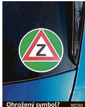
Ohrožený symbol? METRO