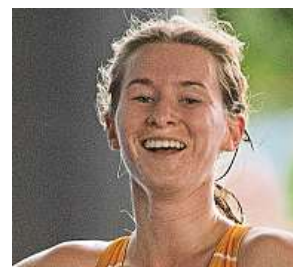
Česká závodnice

Z Evropanek byla Češka třetí nejrychlejší.