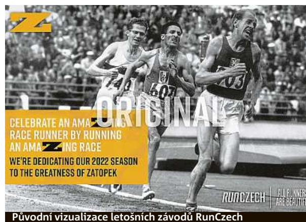
Původní vizualizace letošních závodů RunCzech