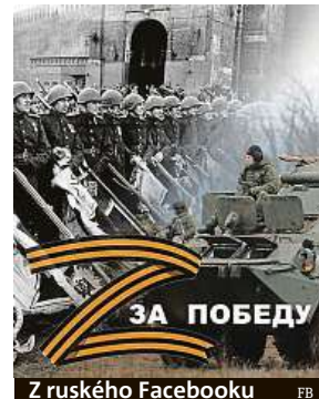
Z ruského Facebooku FB

„Pod tímhle znakem přece nemůžeme prodávat trička!“ Hromadné pomalování písmenem Z na pancéřích ruských obrněnců a aut útočících na Ukrajinu vyvolalo paniku například u obchodníků. Asi týden po ruské invazi se v nabídce Amazonu objevila trička s velkým zetkem a nápisem Za pobědu (za vítězství). Symbol agrese se prodával za necelých dvacet dolarů. Obchod ho stáhl. Protože pochopil, že by ho prodej mohl stáhnout směrem dolů.