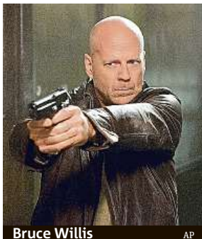
Bruce Willis

James napodobil jiného šampiona NBA Dennise Rodmana, který obdržel antice nu za nejhoršího herce ve vedlejší roli za rok 1997 za