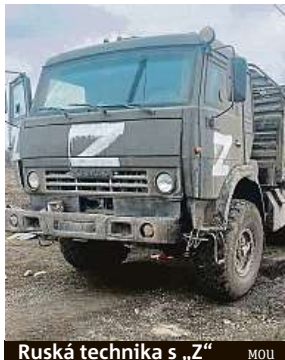
Ruská technika s „Z“ MOU

Až do chvíle, kdy Hitler rozpoutal druhou světovou válku, byla svastika vcelku nevinným „logem“. Teď má nastartováno k zavržení poslední znak abecedy.