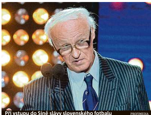
Při vstupu do Síň slávy slovenského fotbalu

V 88 letech zemřel bývalý československý fotbalový reprezentant Titus Buberník, stříbrný medailista z mistrovství světa v roce 1962 v Chile. S národním týmem získal také bronz na prvním evropském šampionátu o dva roky dříve. O jeho úmrtí informoval na svém webu slovenský fotbalový svaz, podle kterého Buberník zemřel v noci na neděli. „Elegance mu byla vlastní jako dýchání. V životě i ve fotbale, v dresu i v saku právníka, pod basketbalovým košem i v kopačkách. Kdyby ke jménu patřil jednoslovný přívlastek, bylo by to slovo džent-