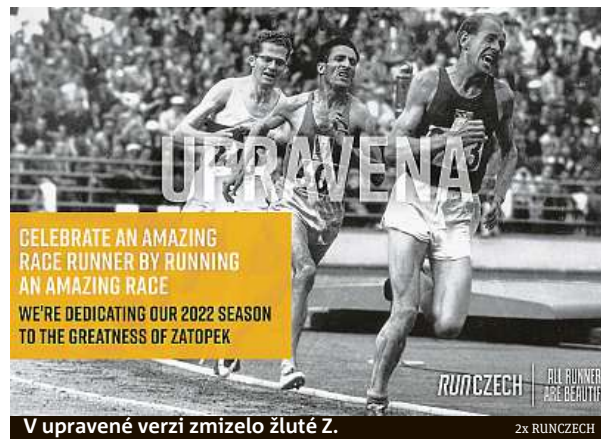
V upravené verzi zmizelo žluté Z. 2x RUNCZECH

Od roku 2012, kdy značka RunCzech vznikla, se závodů zúčastnilo kolem 1 200 000 tisíc běžkyň a běžců všech věkových kategorií. Série běžeckých závodů se datuje až do roku 1995, kdy vznikl Prague International Marathon. V prvním covidovém roce 2020 byly závody zrušené, pořádaly se alespoň omezené akce.