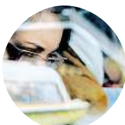
Radlice Kdoviják Určitě by šly zlepšit platy.