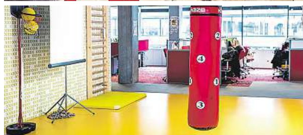
Firma Ogilvy má v kancelářích zahrádky (na foto vlevo). Na dalších snímcích jsou kanceláře Microsoft (nahore) a Home Credit (dole)