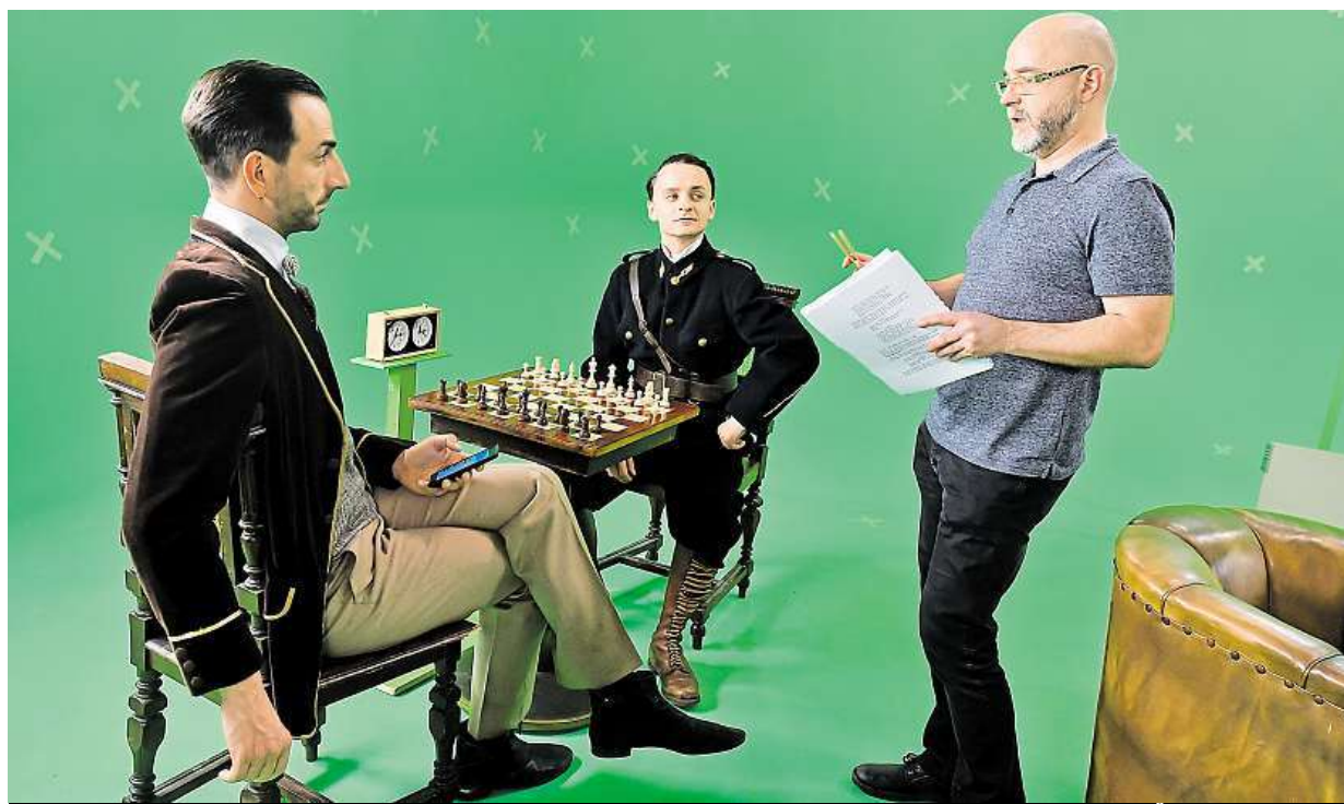
V Praze se točí film s animovanými prvky Cesta do nemožna. Mapuje životní cesty a osudy Milana Rastislava Štefánika. ČTK

Moderní benefit. Zájemce o práci „za stolem“ může zlákat i moderně zařízená kuchyňka či běžecký ovál na střeše firmy. Průzkum. Devadesát procent lidí v kanceláři vyžaduje ticho k soustředění na práci STRANA 4