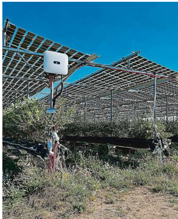
Náklady na pořízení takzvaných agropanelů jsou mnohem vyšší než u běžné voltaiky.

V rámci dvou projektů se jí zabývají pracovníci Výzkumného ústavu zemědělské techniky (VÚZT). Ten novější je zaměřen na výzkum nových postupů pěstování ovocných druhů v kombinovaném využití zemědělské půdy s výrobou a lokálním využitím energie z obnovitelných zdrojů. Výzkumníci jej provádí ve dvou lokalitách – v Litomyšli a v areálu České zemědělské univerzity v Praze. „Výzkum běží druhým rokem. Na celkové hodnocení poznatků projektu je ještě brzy. Máme teprve prvotní výsledky, které analyzujeme,“ informuje vedoucí řešitelského týmu z VÚZT David Hájek. 5 PLUS 2