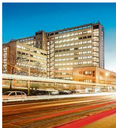
Tato první pražská výšková budova byla postavená roku 1934. DŮM RADOST

Bývalý dům odborářů v Praze 3, který současní majitelé přejmenovali na dům Radost, oslaví 90 let od svého otevření programem, který se zaměří zejména na přiblížení nesvobody v období komunistického Československa. Akce se budou bezplatně konat každou středu od 6. března do 26. června s výjimkou svátků, dopoledne bude program určen školám a odpoledne veřejnosti.