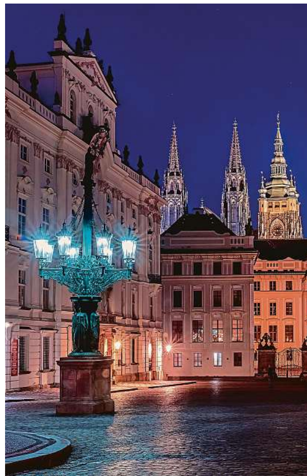
Osmiramenný kandelábr lampy najdete na Hradčanském náměstí.

Podobných sloupů bylo v Praze několik, zbyly jen tři.