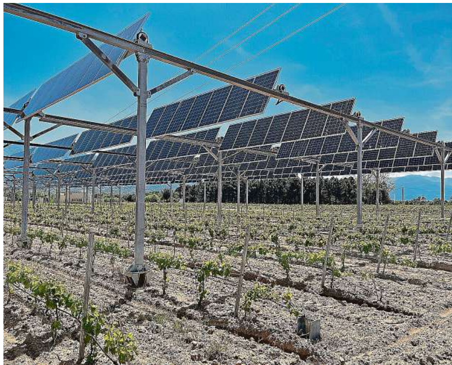
Vedle pěstování zemědělských plodin se na jedné ploše rovněž vyrábí elektrická energie pomocí fotovoltaických panelů.