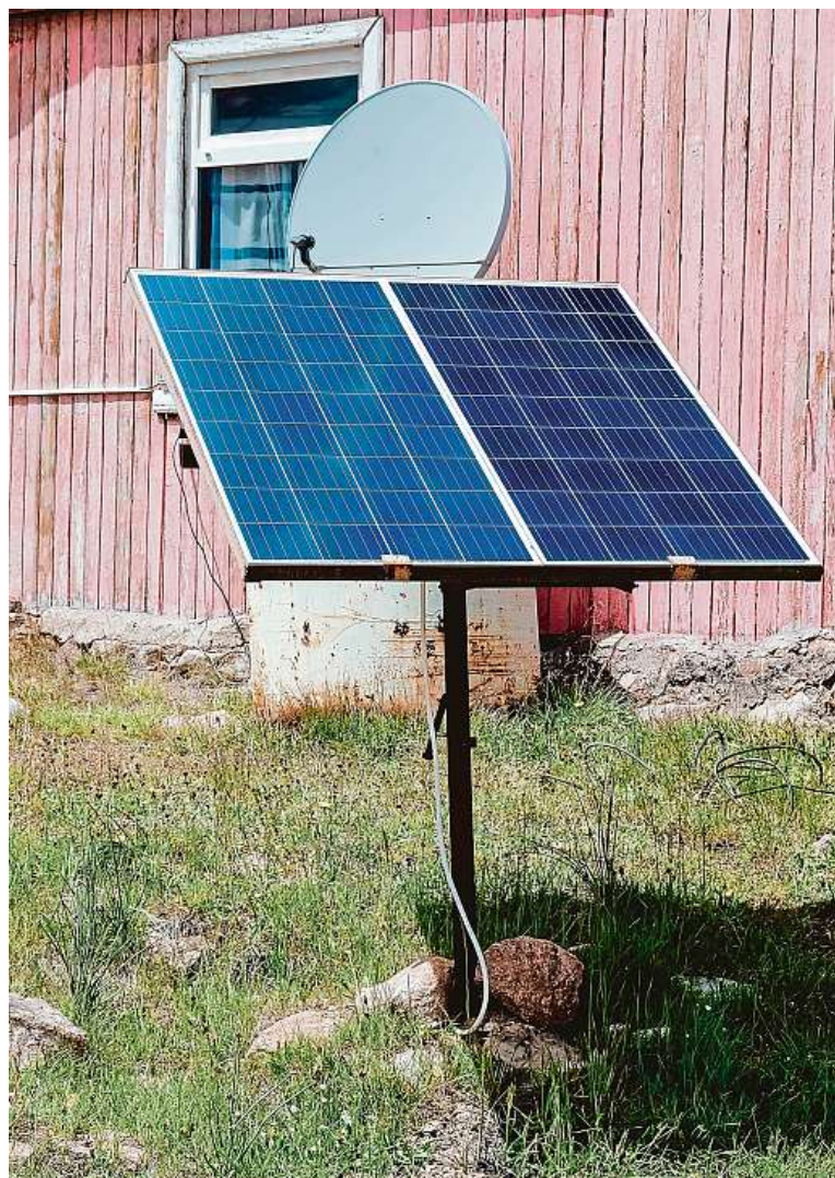
Stačí jen na výrobu energie pro malé spotřebiče.