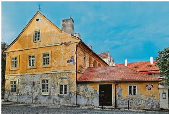
Malostranský obecní špitál vznikl pravděpodobně v 16. století a existoval do roku 1784.

Říká se, že staré gotické malby nechal vymalovat místní kupec. Odvzděl se tak za vyslyšení svých modliteb. Na cestě ho přepadli loupežníci a vše mu ukradli. V zoufalství se uchýlil do kostela, kde se začal modlit. A jeho přání bylo vyslyšeno. Když vyšel před kostel, spatřil jednoho ze zlodějí. Loupežník byl poplaven a mučen. Nakonec pro-