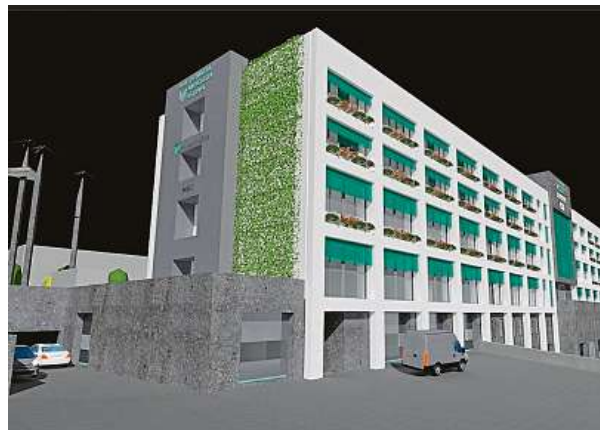
Laboratoře mají v budoucnu sídlit v nové budově Centra pro výzkum energetické a sociální změny. To má vypadat zhruba takto.

My chceme jít jinou cestou a rozvíjet dále technologii pro výrobu takzvaného zeleného vodíku s využitím například solární energie. K tomu potřebujeme také nové materiály, které toto zefektivní. Musíme také zásadně urychlit zavádění digitalizace s využitím umělé inteligence a robotiky v průmyslových provozech pro zvýšení konkurenceschopnosti. Přicházíme s novými řešeními automatizace v dopravě, například ve formě chytrého parkování či antikolizních systémů ve veřejném prostoru. Díky spolupráci s Ostravskou univerzitou budeme toto vše sledovat optikou společenských věd a posuzovat ekonomické dopady i přínosy technologických změn na společnost. Úkolem