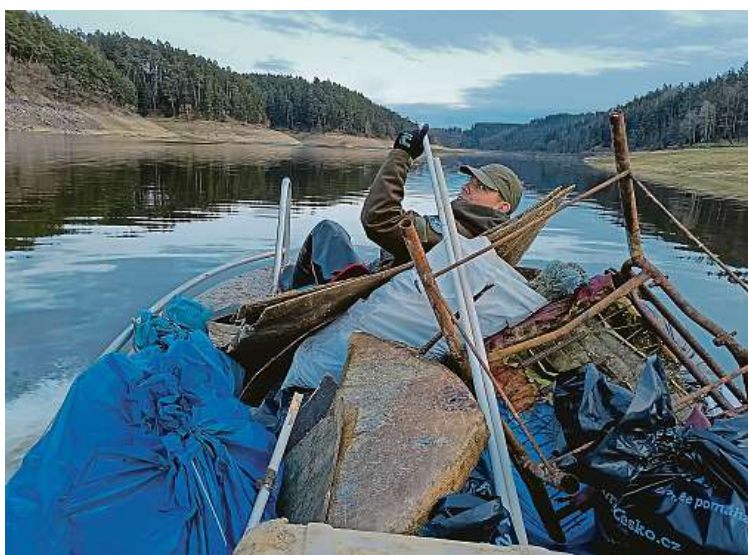
Dobrovolníci v minulých letech vysbírali tuny odpadu i z Orlíku a v jeho okolí. V roce 2020 navíc využili stavu, kdy byla přehrada upuštěna kvůli přestavbě lodního výtahu.

černých skládek v přírodě. Aplikace funguje tak, že uživatelům poradí, kde v jejich okolí legálně a v drtivě většině i bezplatně odevzdat běžný odpad z domácnosti. Zároveň pamatuje na prošlé léky, pneumatiky, vysloužilé elektrospotřebiče i nebezpečný odpad. FILIP JAROŠEVSKÝ