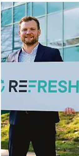
Ivanův projekt má pomoci Moravskoslezskému kraji.