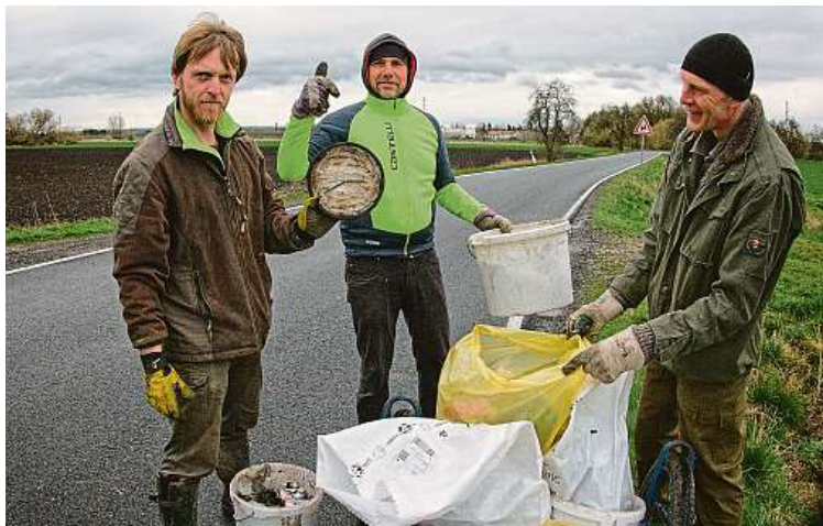
Ratenice jsou obec ležící v úrodné polabské nížině, asi kilometr východně od města Pečky. Místní chlapi jsou známí tím, že se pořádného úklidu nebojí.

„Zapojují se rodiny, skupiny přátel nebo sousedů či kolegů. Proto mohou úklidy mít i komunitní charakter a pozitivní dopad na vzájemné vztahy. Dobrovolníci si mohou napláňovat a registrovat vlastní úklid, nebo se přidat k některému již registrovanému. Na webové stránce kampaně Uklidme svět najdou řadu užitečných informací a tipů, další informace k tomu přidává i ministerstvo,“ doplňuje Markéta Klimo z ČSOP.