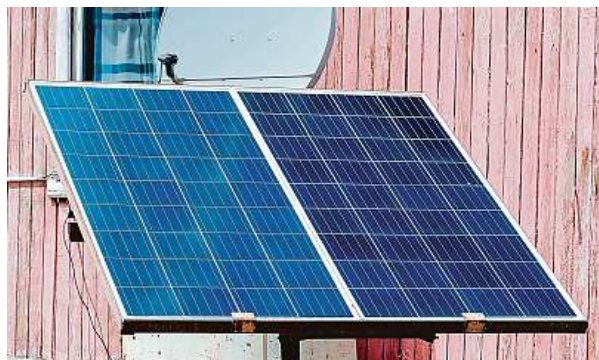
Stačí jen na výrobu energie pro malé spotřebiče.

Panely se nejdříve upevní, měly by mířit na nejlépe na jih, lze ale využít i východ či západ, s tím poradí prodejce. Po upevnění se pomocí dvojice kabelů propojí s měničem – malou plastovou krabičkou, která se prodává v sadě a slouží k tomu, aby bylo možné elektřinu použít pro domácí spotřebiče. Z měniče ústí poslední kabel, obyčejná šňůra, která se zapojí do zásuvky. Elektřina ze sluníčka proudí do sítě, odkud ji mohou čerpat připojené domácí spotřebiče. Taková balkonová sada ovšem nemá žádné úložiště elektřiny. To znamená, že pokud svítí slunce, energii budete rovnou spotřebovujete, nebo bude bez užitku.