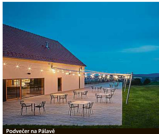
Podvečer na Pálavě