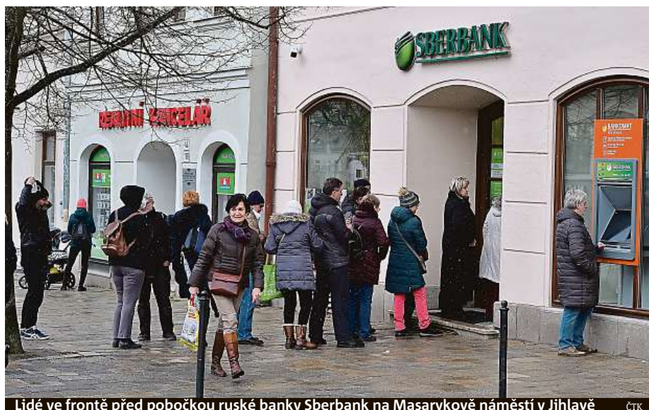
Lidé ve frontě před pobočkou ruské banky Sberbank na Masarykově náměstí v Jihlavě ČTK

Včera skupina Anonymous vyslala vzkaz přímo prezidentovi Vladimíru Putinovi: „Už brzy budete čelit naší plné invazi. Vaše tajemství už nemusejí být v bezpečí.“ ČTK a MET