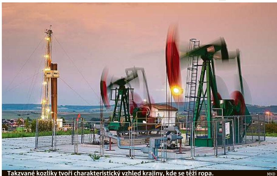
Takzvané kozlíky tvoří charakteristický vzhled krajiny, kde se těží ropa.

Mimochodem, těžba ropy a zemního plynu má na na-