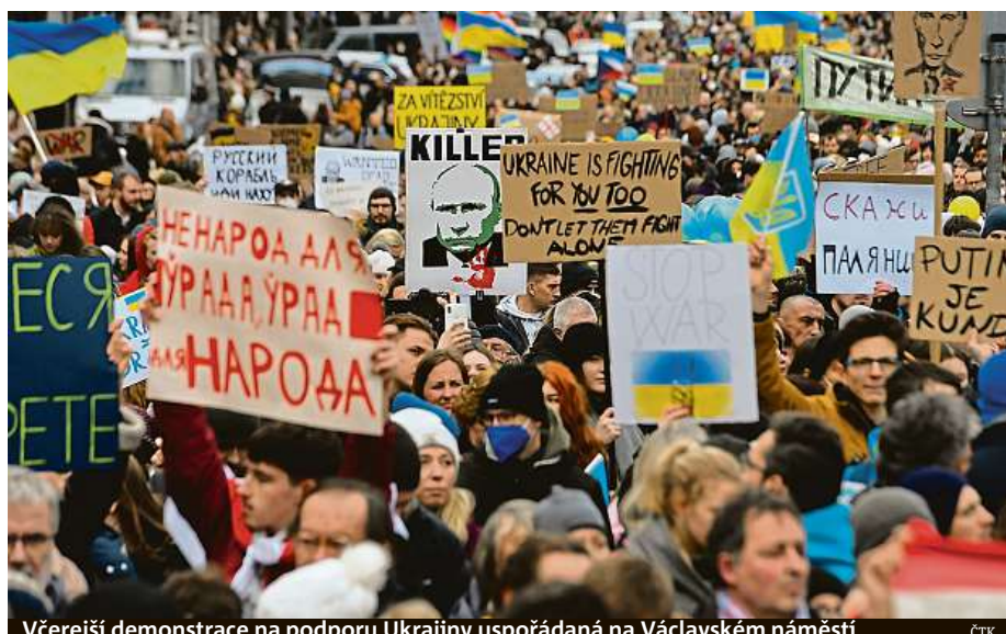
Včerejší demonstrace na podporu Ukrajiny uspořádaná na Václavském náměstí