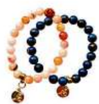
Náramek Bára Poláková 350 Kč