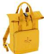
Batoh Sestry Geislerovy 850 Kč

Kompletní nabídku produktů naleznete na www.klokart.cz klokart klokart