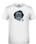
Pánské tričko Jakub Kohák 490 Kč