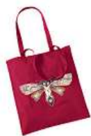
Taška Léna Brauner 300 Kč