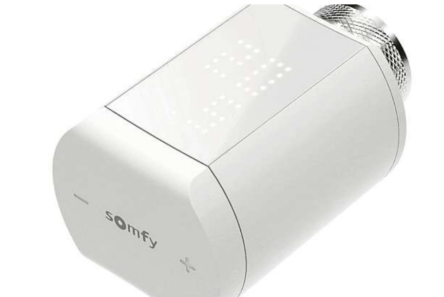
Chytrá hlavice se dá ovládat na dálku.

Jak si poradit alespoň v tom směru, abychom nemuseli doma sedět ve vaťáku a palčácích a zálohy a doplatky za topení nás nedostaly