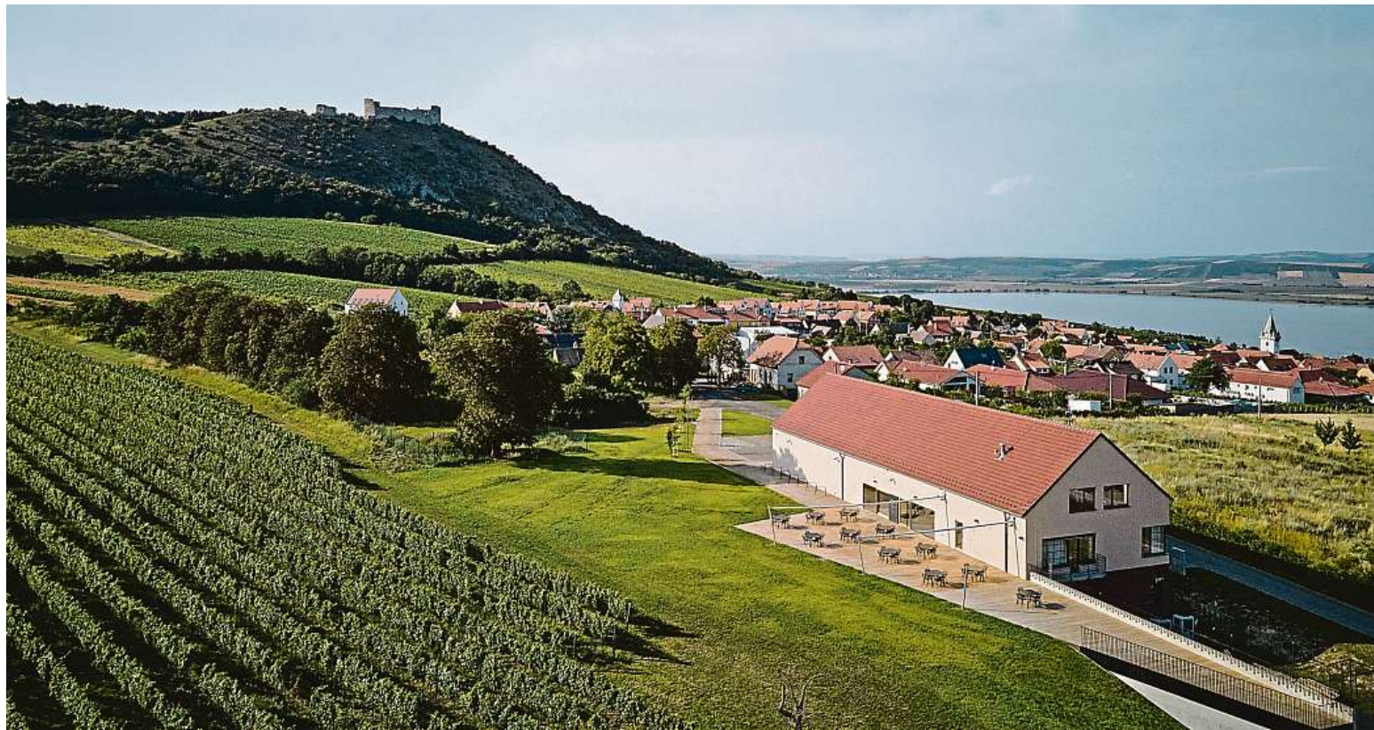
Na Pálavě se rodí vynikající vína, navíc se tu návštěvníci setkají se srdečností vinařů a nádhernými výhledy na Pálavu.