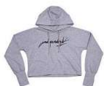
Crop mikina Kaita Hrachovcová 1 390 Kč