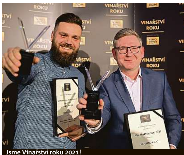
Jsme Vinařství roku 2021!