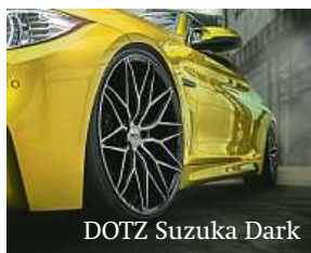
DOTZ Suzuki Dark

Nejen tyto novinky si již nyní můžete prohlédnout ve 3D konfigurátoru kol na www.alcar.cz . Kromě novinek 3D konfigurátor zobrazuje kompletní nabídku homologovaných kol od společnosti Alcar. V případě, že si vyberete jakýkoliv design od značky AEZ nebo DOTZ a objednáte si ke kolům bezpečnostní šrouby či matice Sicuplus, dostanete je od Alcaru jako dárek zdarma. Tato akce platí od 1. 3. do 30. 6. 2020.