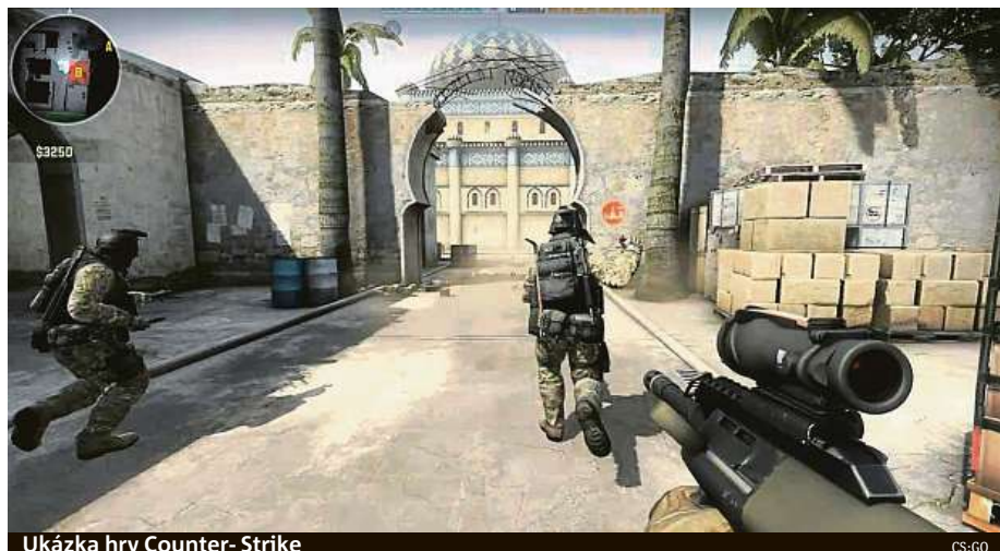
Ukázka hry Counter-Strike

Kromě dlouhodobých výsledků se mu také líbilo to,