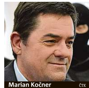
Marian Kočner

Shodný trest vězení ve výši 19 let uložil slovenský soud podnikateli Marianu Kočnerovi a exministrovi hospodářství a někdejšímu šéfovi soukromé televize Markíza Pavolu Ruskovi. Oba uznal vinnými z padělání čtyř smének v hodnotě téměř 69 milionů eur a z maření spravedlnosti. Kočnerovi vyměřil navíc pokutu 10 tisíc eur. Verdikt není pravomocný. Oba se podle advokáta odvolají. Proplacení smének požadovala od Markízy i jedna z firem Kočnera, který čelí obžalobě z objednání předloňské vraždy investigativního novináře Jána Kuciaka.