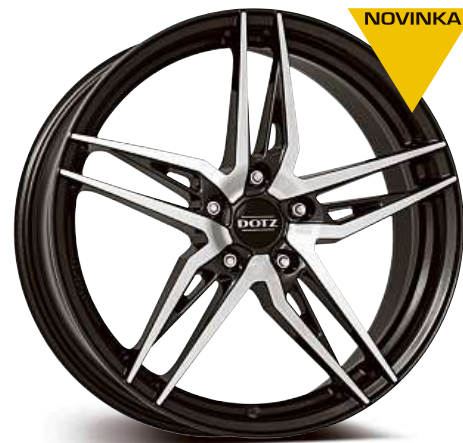
DOTZ Interlagos dark 17", 19"