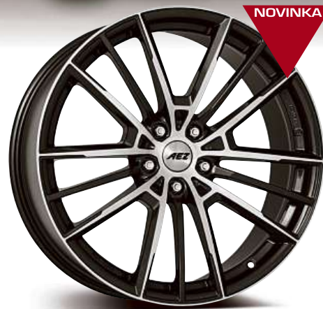
AEZ Kaiman dark 17", 18", 19", 20"