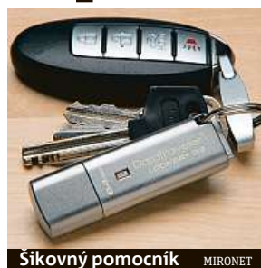
Šikovný pomocník MIRONET

Tyto na první pohled obyčejné „flešky“ nabízí kombinaci hardwarového šifrování uložených dat a zabezpečení pomocí hesla. Pokud se potom kdokoli vašeho zařízení zmocní a pokusí se z něj ukrást citlivá data, zařízení se po deseti neplatných pokusech o přihlášení samo zfor-