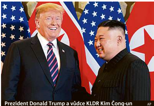
Prezident Donald Trump a vůdce KLDK Kim Čong-un

Osm měsíců po prvním, historickém setkání v Singapuru si šéfové USA a KLDK opět třásli rukama.