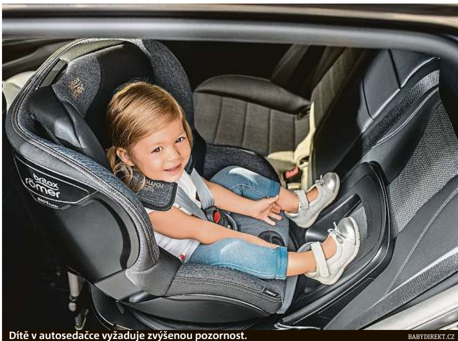
Dítě v autosedačce vyžaduje zvýšenou pozornost.

Důležité je také zkontrolovat, že pásy vedou přesně tam, kde mají, že dětem nesklouzávají z ramen a podobně. Abyste mohli snadno zkontrolovat, zda je dítě správně připoutané, doporučujeme pořídit autosedačku, která se dá otáčet. Dítě si tak pohodlně otočíte ke dveřím a snadno zkontrolujete, zda je vše v pořádku.