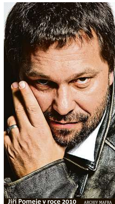
Jiří Pomeje v roce 2010

pohádky Princezna ze mlejna a Z pekla štěstí, ale jeho Andělská tvář byl propadák. Pomeje měl několikamilionové dluhy, do toho přišel alkohol, následovaly neúspěšné vztahy. Zemřel na rakovinu hrtnu, která mu metastázovala do kostí a do celého těla. Bojoval s ní od poloviny roku 2017, kvůli ní postupně přišel o hlas i zrak. iDNES.cz