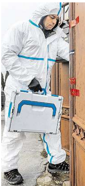
Na místě vraždy