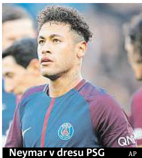
Neymar v dresu PSG AP

Zraněnému nejdražšímu fotbalistovi světa Neymarovi hrozí operace a až dvouměsíční pauza. Brazílský útočník Paris St. Germain si v nedělním utkání francouzské ligy s Marseille vedle podvrtnutého kotníku zlomil nártní kůstku na pravé noze. ČTK