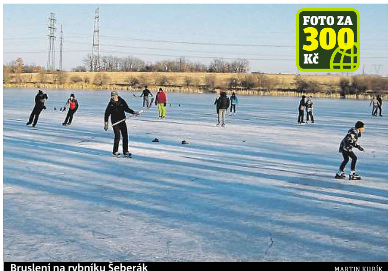
Bruslení na rybníku Šeberák