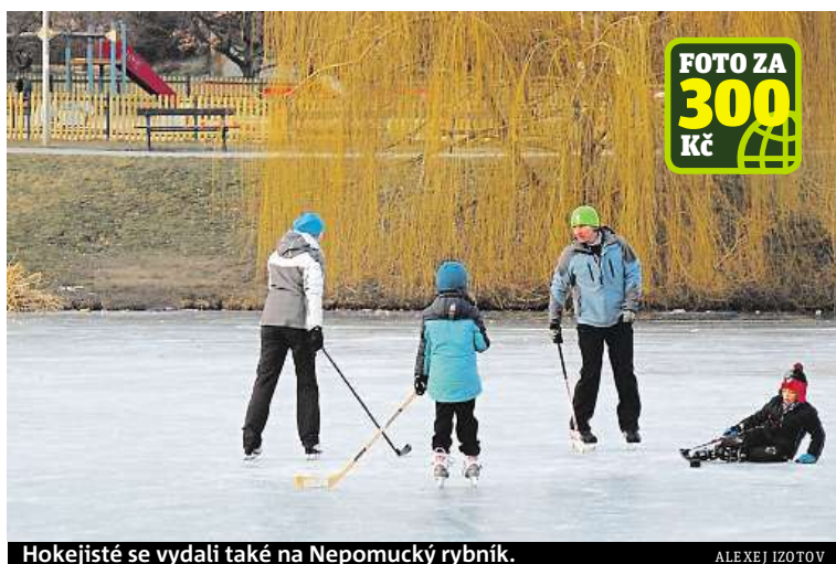
Hokejisté se vydali také na Nepomucký rybník.