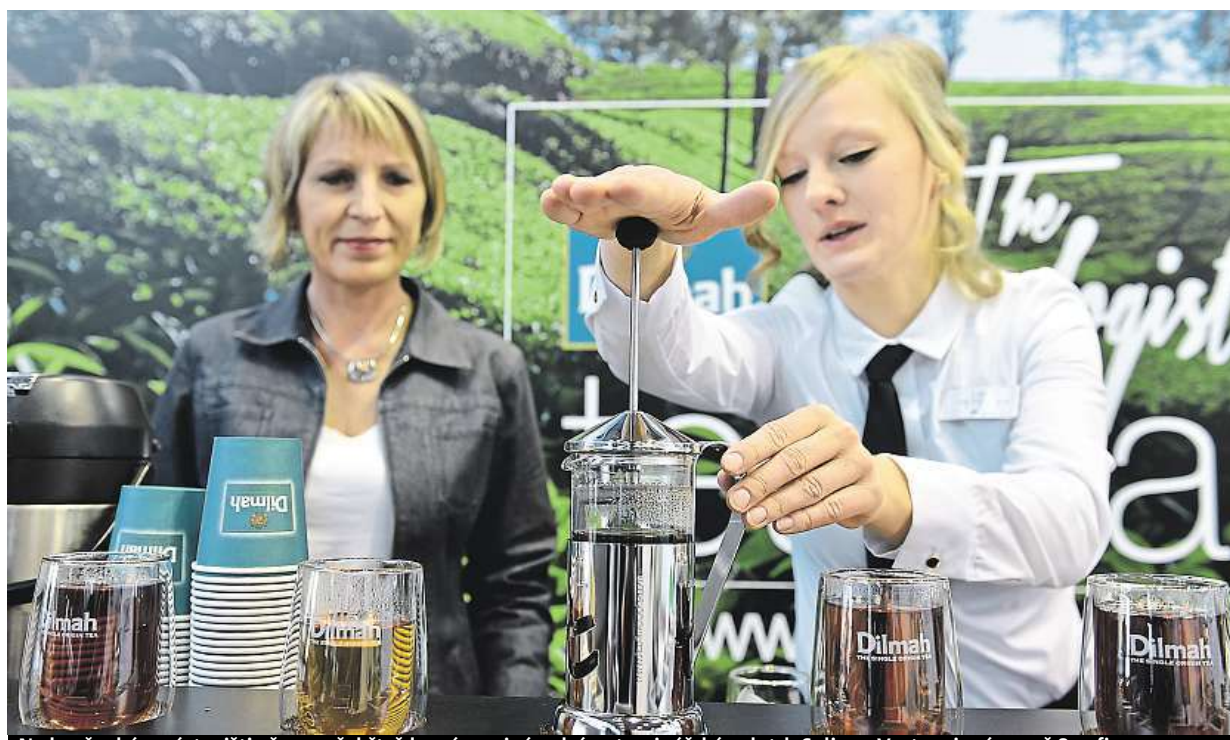
Na brněnském výstavišti včera začal čtyřdenní mezinárodní potravinářský veletrh Salima. Vystavuje více než 800 firem.

Osobáky s naftovým pohonem. V Německu budou mít problém, města jim chtějí zakázat vjezd. Čeští starostové. Kvůli volbám dieselové vozy zatím tolerují. Elektromobil. Jeho cena je asi třikrát vyšší STRANA 9