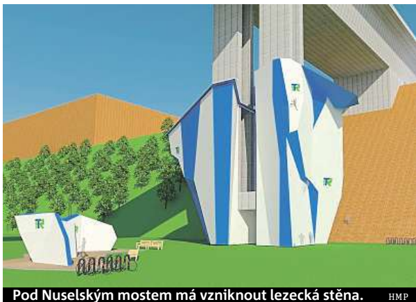
Pod Nuselským mostem má vzniknout lezecká stěna. HMP

Podle náměstka pro dopravu a sport Petra Dolínka půjde o vůbec nejvyšší stěnu v metropoli. Nápad, jehož je