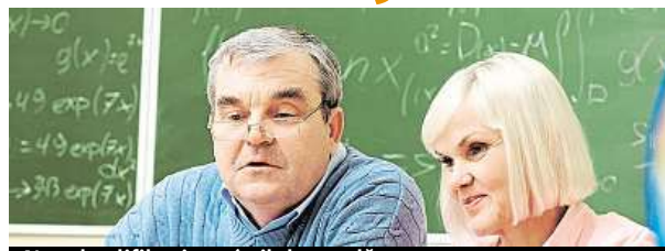
Na rekvalifikaci není nikdy pozdě.

Je třeba, aby se jednalo o uchazeče nebo zájemce o zaměstnání, který je v evidenci ÚP ČR. Délka evidence přitom nehraje roli. Dotyčný musí mít také odpovídající předpoklady požadované v rámci konkrétního kurzu. Například stupeň vzdělání, určité dovednosti a znalosti, jako je třeba práce s počítačem, řídicí průkaz apod. Rekvalifikační kurzy musí být potřebná a také účelná. V neposlední řadě je nutné, aby byl zájemce zdravotně způsobilý, a to nejen pro absolvování kurzu, ale