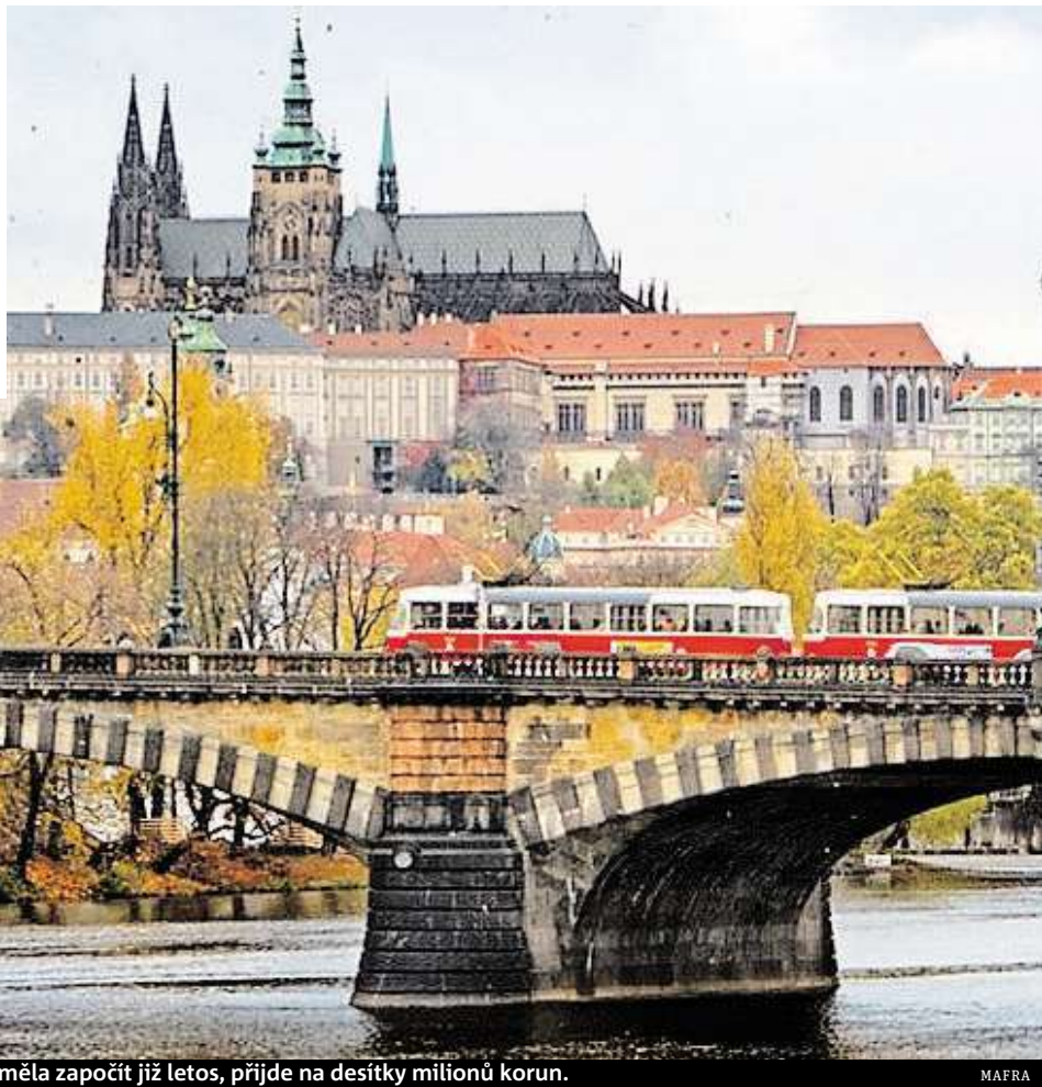
Most Legií spojuje Národní třídu s Újezdem. Jeho oprava by měla započít již letos, přijde na desítky milionů korun.