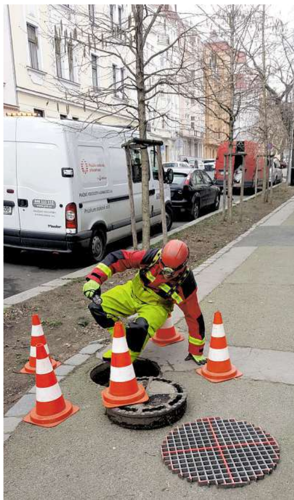
Odborní pracovníci provádějí průzkum v Kamenické ulici.