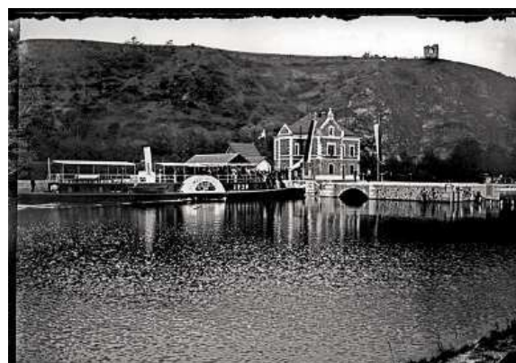
Dostavěnou čistírnu odpadních vod v Bubenči si v roce 1906 prohlédl císař František Josef I. z parníku.