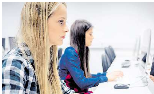
Studenti by neměli podceňovat možnost stáží.

V některých oborech, například v IT, překračují nástupní mzdy i 40 tisíc korun, běžně dosahují i mimo Prahu 30 tisíc korun. „Dobrou zprávou přitom je, že rozdíl mezi mzdami absolventů technických a humanitních škol již nejsou tak dramatic-