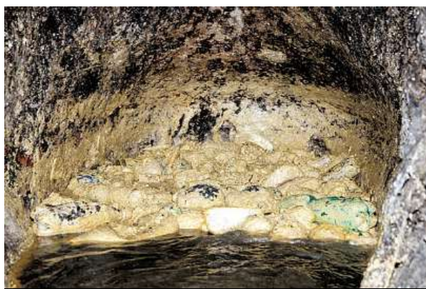
Oleje ztuhnou, zanášejí kanalizaci a mohou způsobit ucpání.

Rozhodně se do kanalizace také nesmí dostat biologicky