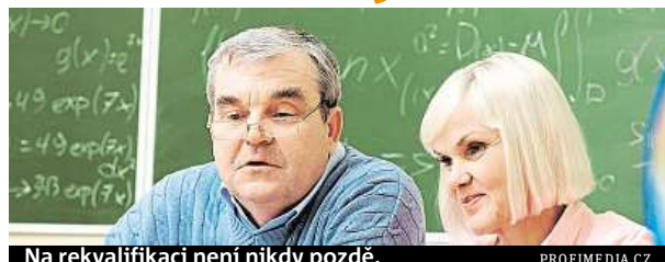
Na rekvalifikaci není nikdy pozdě.

Je třeba, aby se jednalo o uchazeče nebo zájemce o zaměstnání, který je v evidenci ÚP ČR. Délka evidence přitom nehraje roli. Dotyčný musí mít také odpovídající předpoklady požadované v rámci konkrétního kurzu. Například stupeň vzdělání, určité dovednosti a znalosti, jako je třeba práce s počítačem, řidičský průkaz apod. Rekvalifikační kurzy musí být potřebná a také účelná. V neposlední řadě je nutné, aby byl zájemce zdravotně způsobilý, a to nejen pro absolvování kurzu, ale