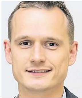
Tomáš Hejkal ARCHIV

Jak těžké je vyvážit chuť a kdo se o to stará? Je do-