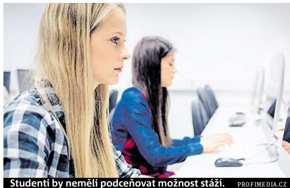
Studenti by neměli podceňovat možnost stáží.

V některých oborech, například v IT, překračují nástupní mzdy i 40 tisíc korun, běžně dosahují i mimo Prahu 30 tisíc korun.“ Dobrou zprávou přitom je, že rozdíl mezi mzdami absolventů technických a humanitních škol již nejsou tak dramatické. Je to zejména díky širšímu uplatnění humanitních absolventů v segmentu podnikových služeb, kde je ovšem výrazný tlak na znalost cizích jazyků.