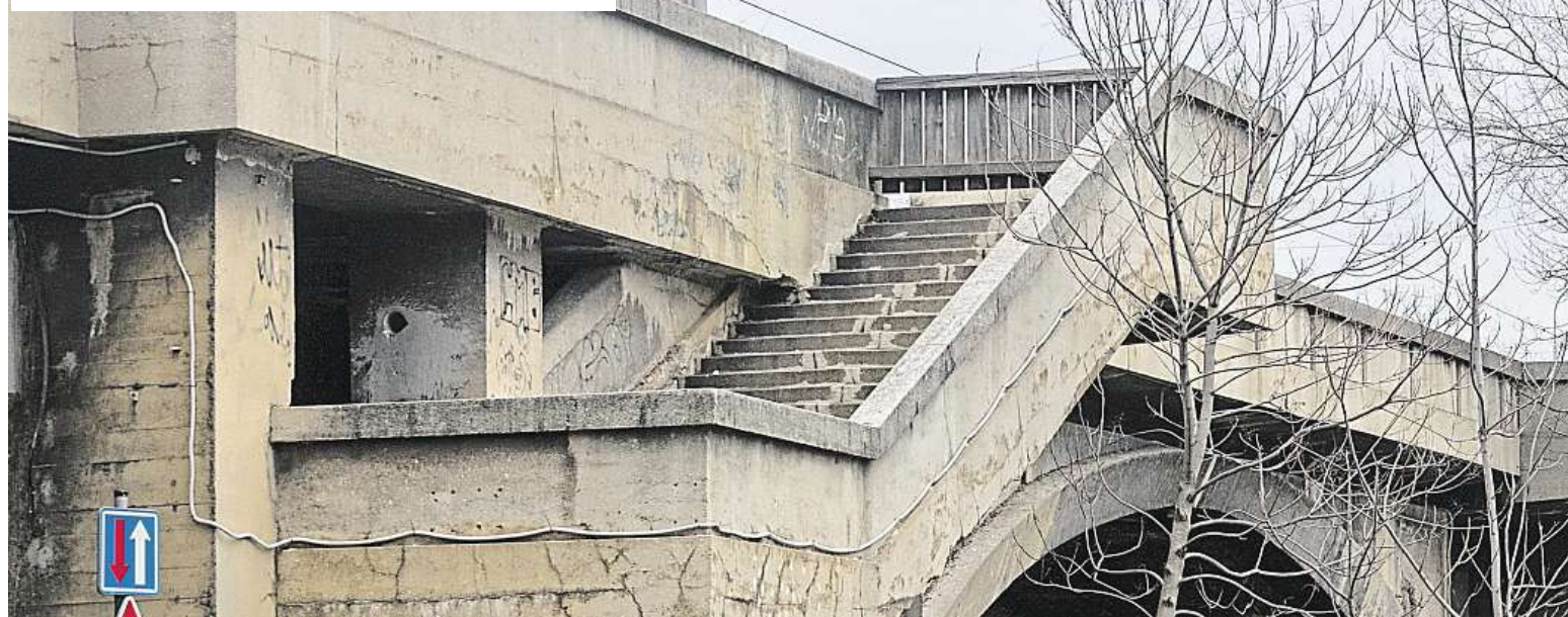
Konstrukce Libeňského mostu oslabila místy až o 14 procent.