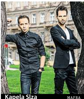
Kapela Slza

Od 15. do 23. března naváže Febiofest, který také slaví jubileum, jde už o 25. ročník. Jednou ze speciálních sekcí tak bude Best of, jež představí deset nejoblíbenějších filmů uvedených od roku 1993. Na zahájení dorazí herec