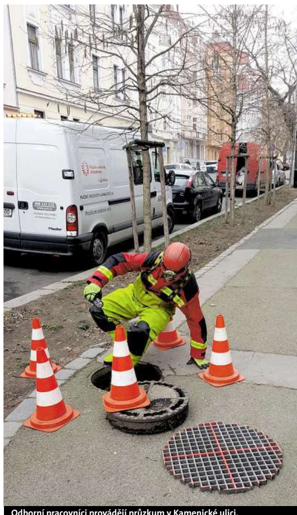
Odborní pracovníci provádějí průzkum v Kamenické ulici.