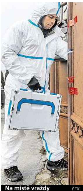
Na místě vraždy