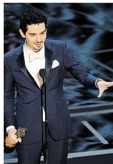
Režisér Damien Chazelle

La La Land přesto získal nejvíce cen. Odnesl si šest sošek a Damien Chazelle je ve 32 letech nejmladším držitelem Oscara za nejlepší režii. Snímek bodoval i v kategoriích hudba, výprava, kamera a píseň City of Stars. Cenu za nejlepší herečku v hlavní roli převzala Emma Stoneová, která také zářila v La La Landu. Mezi muži ale bodoval Casey Affleck za roli ve snímku Místo u moře. PUR, ČTK