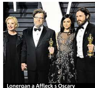
Loneragan a Affleck s Oscary