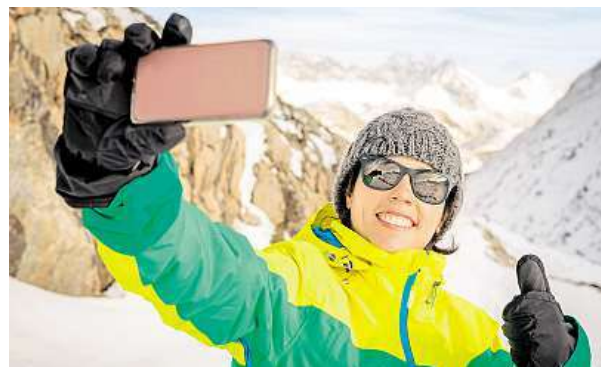
Nepodceňujte na horách ochranu svého zraku.

Pokud člověk vyrazí za slunného počasí na svah ve vysokých horách bez slunečních brýlí, hrozí mu další komplikace – sněžná slepota. „Vzniká v důsledku nadměrného vystavení nechráněného oka UV záření ve vyšších nadmořských výškách, kde je dávka záření zvýšena odrazem od sněhu. Projevuje se po několika hodinách silnou bolestí a světloplachostí. Pod-