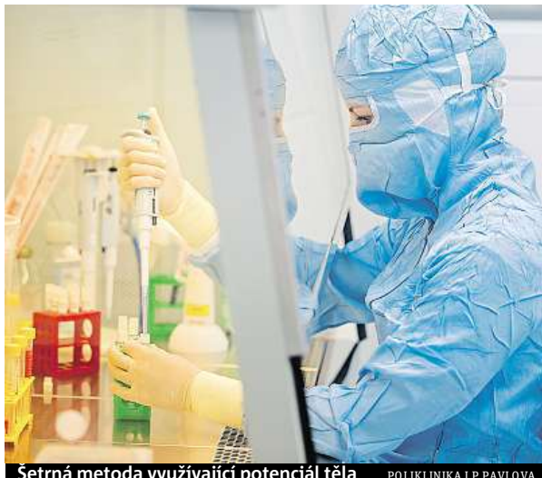
Šetrná metoda využívající potenciál těla

Vlastnímu zákroku předchází vyšetření dermatologem, který zhodnotí stav pleti a na základně anamnézy a klinického nálezu doporučí další postup. Konzultace je bezplatná. Pokud je pacient vhodný pro tuto metodu a s postupem souhlasí, získá